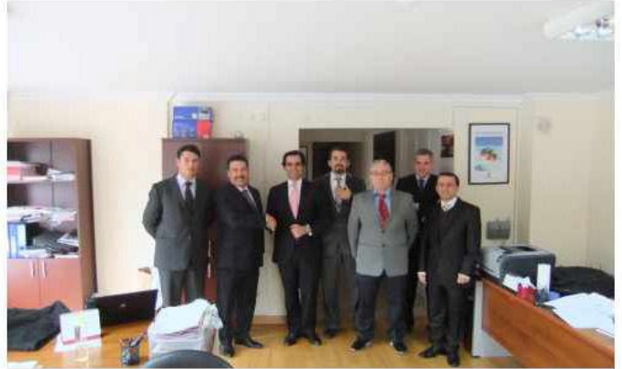
BAMESA yetkilileri ile sözleşme 12 Ocak 2012 tarihinde imzalandı.

Tüm inşaat işlerinin kontrollüğünü "Bureau Veritas Gözetim Hizmetleri Ltd. Şti." nin üstlendiği tesis 6 ay gibi kısa bir sürede tamamlanarak 25 Temmuz 2012 tarihinde teslim edilecektir.