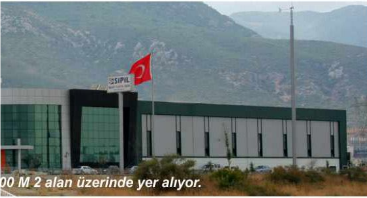
00 M 2 alan üzerinde yer alıyor.