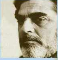
Ümit Yaşar Oğuzcan (1926-1984)