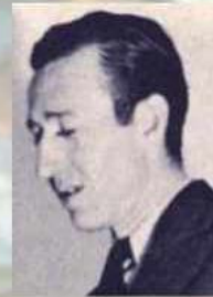
Orhan Veli Kanık (1914-1950)

Sağlığımda açıldı kosmos yolu, Moskova'da açılış törenindeyim. Avucumda bir çocuğun sarışın eli, bir yılbaşı ağacı önündeyim. Biliyordum, yaşına bile gelmeden, gözlerinde sırça toplar yanan çocuk, yolcu füzeleri güneşe doğru, yıldızların arasından, balıklar gibi sessiz sedasız akıp gidecek. Ama füze yolcuları yola çıkabilecek mi pasaportsuz? Bilet olacak mı? Parayla mı alacaklar? Ve uzaklaşıp karpuzlaşır, elmalaşırken dünyamız, ıstıratosferde savaş füzelerine mi rastgelecekler? Beni ilgilendiren bavullarının eşyası değil, yüreklerinin yükü. Korkuyorlarsa kimden, neden, niçin, nasıl? Ya ara hırsı? Emir verme merakı? Yüzüne yılbaşı ağacının telli pullu aydınlığı vuran çocuk, belli, bilmiyorum neden, ama belli yaşayacak benden iki kere çok. Kosmosa filan gidip gelecek. İş bunda değil. Yeryüzünde görececek mucizenin büyüğünü : tek insan milletini pırl pırl. Ben iyimserim, dostlar, akarsu gibi...