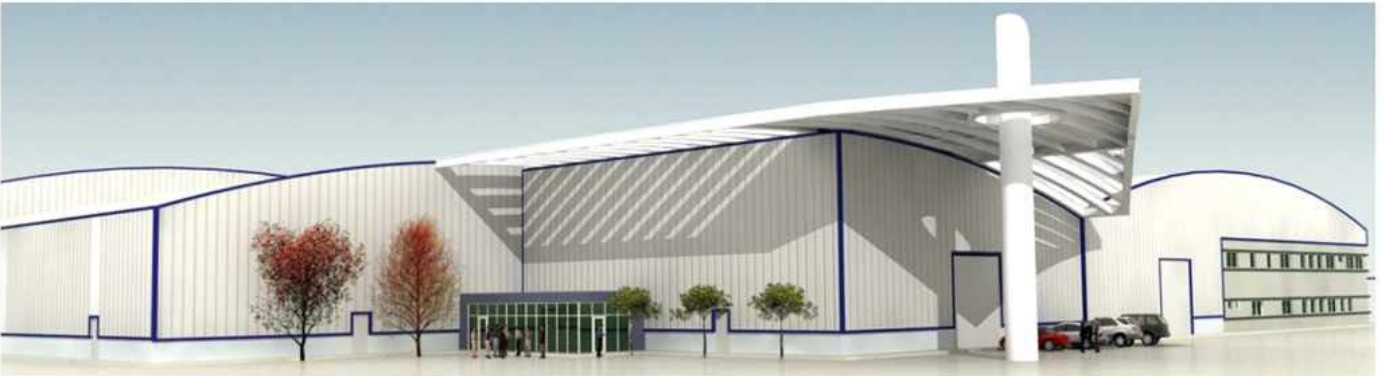
Denizciler Döküm ek bina projesi tasarımı Sipil A.Ş. Teknik Ofis tarafından gerçekleştirildi.