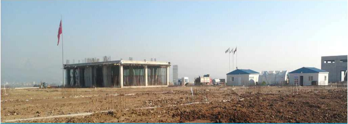
FORM A.Ş. Pancar OSB Fabrika ve İdari Binası yaklaşık 14.500 m2 kapalı alandan oluşuyor.

16.09.2011 tarihinde yer teslimiyle başlayan ve 14.10.2011 tarihinde yapılan temel atma töreniyle devam eden süreçle beraber FORM A.Ş pancar fabrika binası temel ve idari bina kaba inşaat işleri iş programına uygun olarak 2011 yılının son günlerinde tamamlanmıştır.