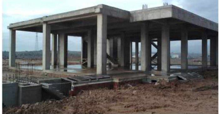
FORM A.Ş. Fabrika ve İdari Bina Kaba İnşaatı tamamlandı.