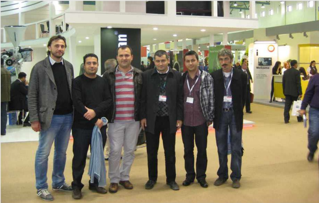
SİPİL Plastik Manisa ve Eskişehir İşletme yönetim ekibi ve çalışanları Plast Eurasia İstanbul fuarına katıldı.

Yönetimi Gözden Geçirme Toplantısında alınan karar doğrultusunda SİPİL PLASTİK Grubu bu yıl ana sanayi ürün ve hizmet üretimine ilişkin cirosunu arttırmayı ve bu amaçla ihracata yönelik girişimlerini derinleştirmeyi hedeflemiştir.