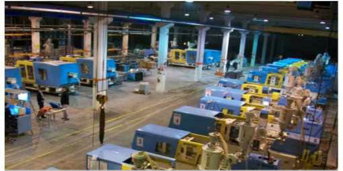
SiPİL A.Ş PLASTİK Eskişehir İşletmesi 2012 yılına yeni yatırımlarıyla kapasitesini ikiye katlayarak girdi.

SİPİL Plastik grubu Manisa ve Eskişehir işletmelerinde bulunan 63 adetlik enjeksiyon makinesi parkıyla yılda ortalama 6 milyon kg plastik ürün üretiyor. Başta beyaz eşya sektörü olmak üzere ısıtma, soğutma, havalandırma, elektronik-otomotiv ana sanayilerine hizmet vermeyi sürdüren plastik grubumuz enerji verimliliğine yönelik çalışmaları ve otomasyonu arttırmaya yönelik uygulamalarıyla teknolojik altyapı geliştirme ataklarını sürdürüyor.