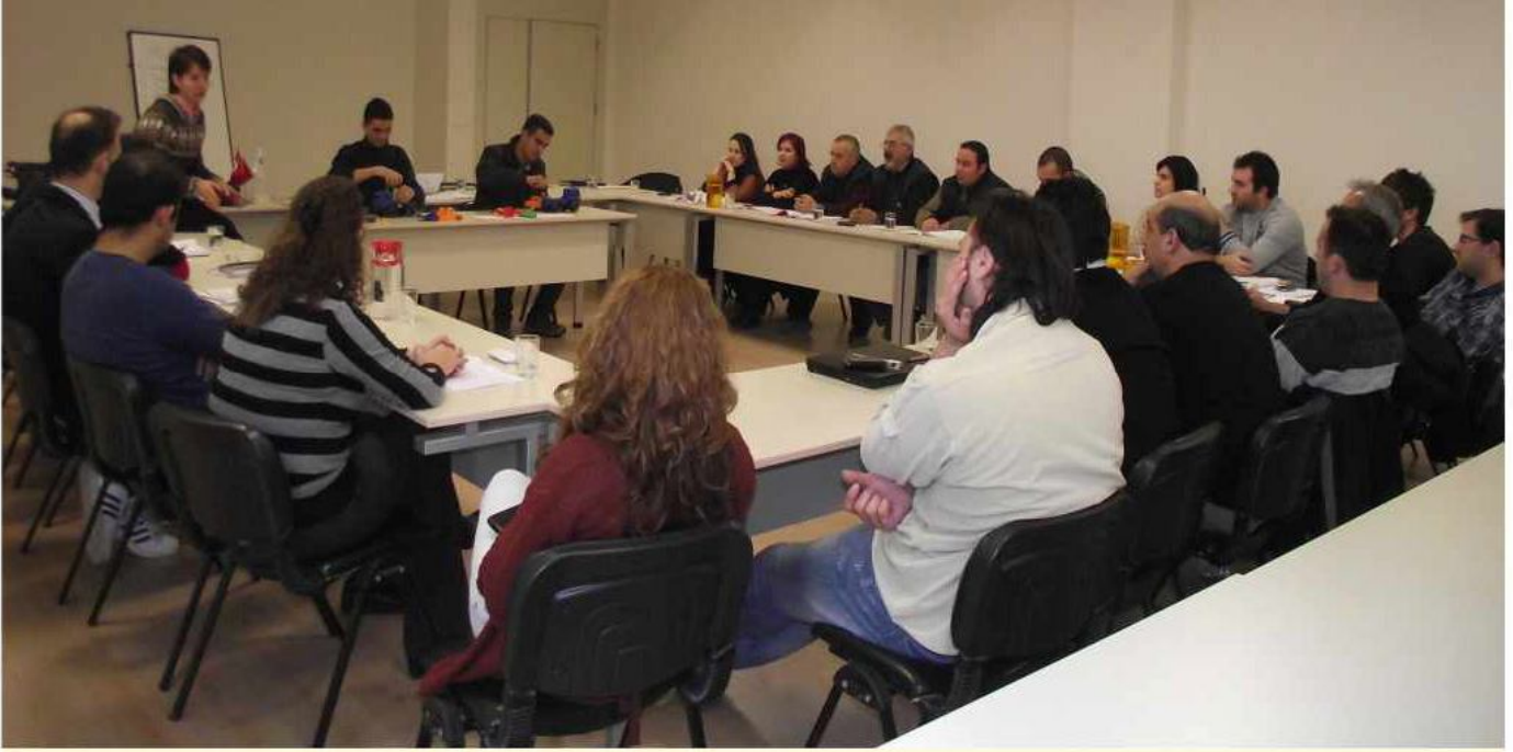
SİPİL A.Ş. Gruplarında 2011 Yılında 3923 saat eğitim gerçekleşti.

2010 yılı içerisinde toplam 3335 saat eğitim gerçekleştiren Sipil A.Ş. 2011 yılında yüzde 18 eğitim/saat artış göstererek tüm gruplarında 3923 saat eğitim gerçekleştirmiştir.