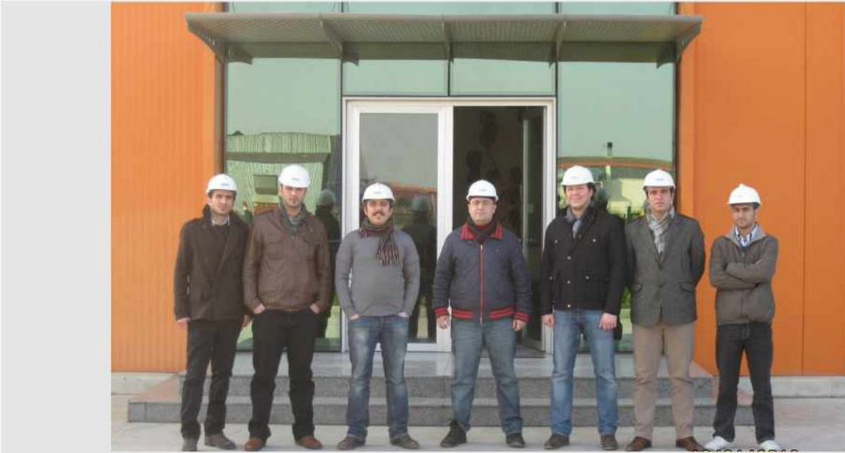
CbÜ Sky Bridge Takımı Köprü Tasarım Çalışmalarının ardından SİPİL ÇELİK'te Üretimi Gerçekleştirilecektir.

Bu doğrultuda yarışmaya başvuruda bulunmuş olan SKY BRIDGE takımı öğrencilerine başarılar diliyoruz. SİPİL ÇELİK tarafından sponsor olunan SKY BRIDGE takımının çelik imalatlarına ait malzeme temini ve üretimi Manisa Organize Sanayi Bölgesindeki fabrikamızda gerçekleştirilecektir.