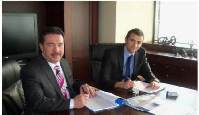
SABAF Beyaz Eşya Parçaları Ltd. Şti. sözleşmesi Ocak 2012 tarihinde gerçekleşti.