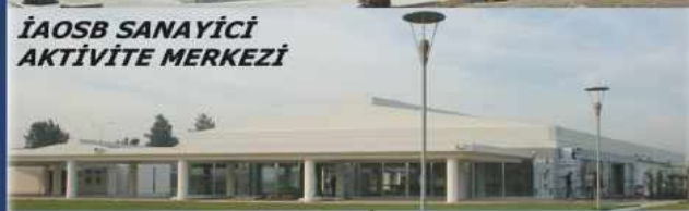
İAOSB SANAYİCİ AKTİVİTE MERKEZİ