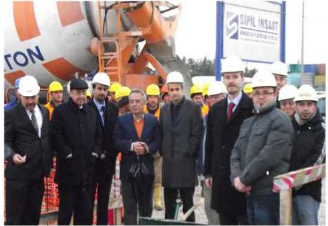
SABAF Beyaz Eşya Parçaları Ltd. Şti. Manisa OSB Fabrikası temel atma töreni gerçekleşti.

Ayrıca SİPİL A.Ş. İş Güvenliği ekibince belirli periyotlarla İş Güvenliği denetimleri yapılmaktadır. Gerçekleştirilen denetimler sonucunda 'sıfır iş kazası' hedefine ulaşılması için büyük çaba harcanmakta ve çalışan tüm personele İş güvenliği eğitimi verilmektedir.