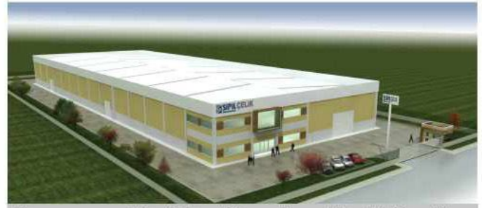
Tasarım ve projelendirilmesi tamamlanan Tire Fabrikası Sac üretim amaçlı olarak yatırım için gün sayıyor.

SİPİL A.Ş. 2012 yılına özetle ifade ettiğimiz bu rakamlar ve hedeflerle başladı. Birlikte üretme anlayışıyla gelenekselleşen Yönetim Gözden Geçirme (YGG) toplantılarıyla tüm çalışanlarından edinilen görüş ve öneriler ilgili süreç sorumlularının sunumlarıyla paylaşıldı, kararlara ve hedeflere dönüştü. Bir önceki yılın karar ve hedefleri gözden geçirildi. Eylem planları tamamlandı. Şimdi amacımız bu plan doğrultusunda 2012 yılını en iyi şekilde değerlendirerek birlikte oluşturduğumuz hedeflere ulaşmaktır.