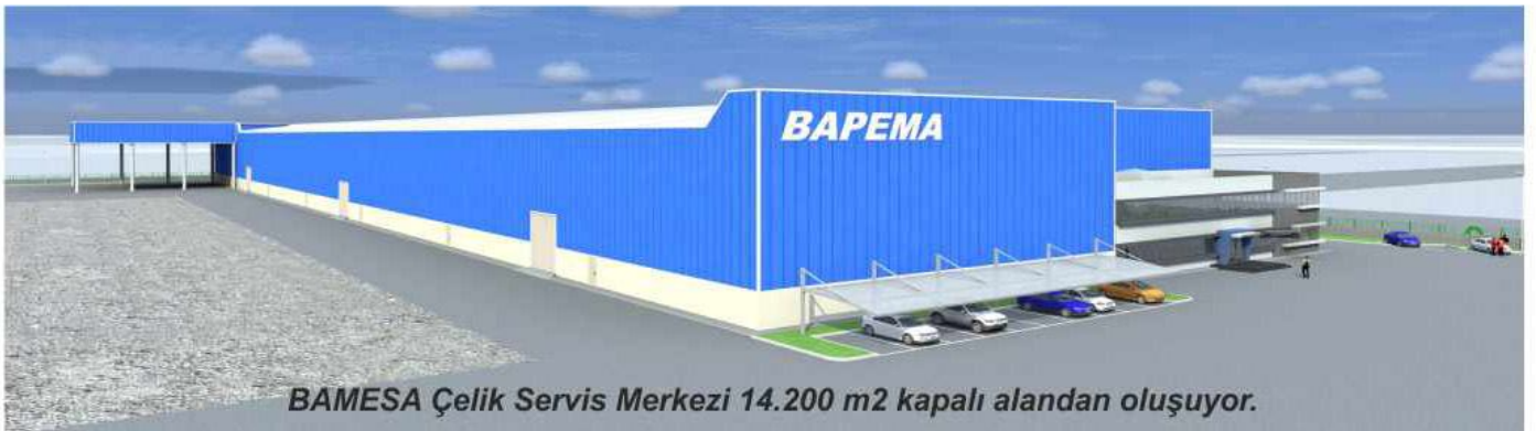
BAMESA Çelik Servis Merkezi 14.200 m2 kapalı alandan oluşuyor.