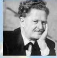
Nazım Hikmet Ran (1901-1963)

Bir gün bu kapıdan sen gireceksin Biliyorum Ergeç bu bekleyişin bir sonu gelecek Yıllarca sonra Öldüğüm gün bile gelsen Bütün bu bekleyişlerimi ve öldüğümü unutup Çocuklar gibi sevineceğim Kalkıp sarılacağım ellerine Uzun uzun ağlayacağım