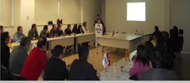
SiPİL A.Ş 2012 yılı Yönetim Gözden Geçirme Toplantısı 14 Ocak 2012 tarihinde gerçekleşti.

SİPİLAŞ 1984 yılından bugüne ülkemizin kalkınmasının üretimden ve öncelikle sanayileşmeden geçtiği bilinciyle çalışmalarını bir mühendislik grubu olarak kararlılıkla sürdürüyor. 28. Kuruluş yıldönümünü 19 Ocak 2012'de kutlayan SİPİL AŞ 35'i mühendis-mimar olmak üzere 50'yi aşan idari personeli ve 300'e ulaşan çalışanı ile takım olma anlayışıyla geliştirdiği yönetim teknikleriyle değer yaratmaya devam ediyor. Çalışan sayısı bazında 2004 yılında bugün ve her yıl ortalama yüzde 30 büyüme hızıyla bugün 300 çalışanı ile büyük bir aileye dönüşen SİPİL AŞ, bu büyüme hızıyla ülkemizin en önemli sorunlarından biri olan istihdamın geliştirilmesinde katkıda bulunuyor.