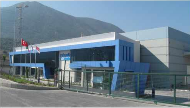
SiPİL İnşaat ölçekte 120'yi aşkın endüstriyel yapıyı, anahtar teslimi gerçekleştiriyor olmasının gururunu yaşıyor.

SİPİLAŞ 1984 yılından bugüne ülkemizin kalkınmasının üretimden ve öncelikle sanayileşmeden geçtiği bilinciyle çalışmalarını bir mühendislik grubu olarak kararlılıkla sürdürüyor. 28. Kuruluş yıldönümünü 19 Ocak 2012'de kutlayan SİPİL AŞ 35'i mühendis-mimar olmak üzere 50'yi aşan idari personeli ve 300'e ulaşan çalışanı ile takım olma anlayışıyla geliştirdiği yönetim teknikleriyle değer yaratmaya devam ediyor. Çalışan sayısı bazında 2004 yılında bugün ve her yıl ortalama yüzde 30 büyüme hızıyla bugün 300 çalışanı ile büyük bir aileye dönüşen SİPİL AŞ, bu büyüme hızıyla ülkemizin en önemli sorunlarından biri olan istihdamın geliştirilmesinde katkıda bulunuyor.