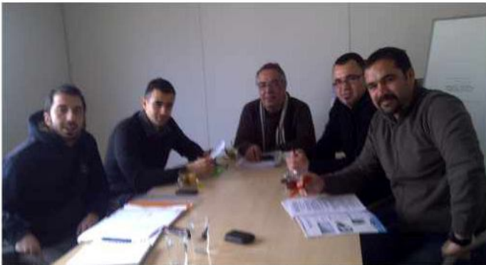
SABAF Manisa OSB Fabrikası Şantiye Toplantılar periyodik olarak düzenleniyor.