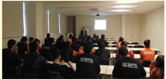
SİPİL A.Ş. PLASTİK Grubundaki tüm çalışanlara 5S ve yalın üretim teknikleri eğitimleri verildi.