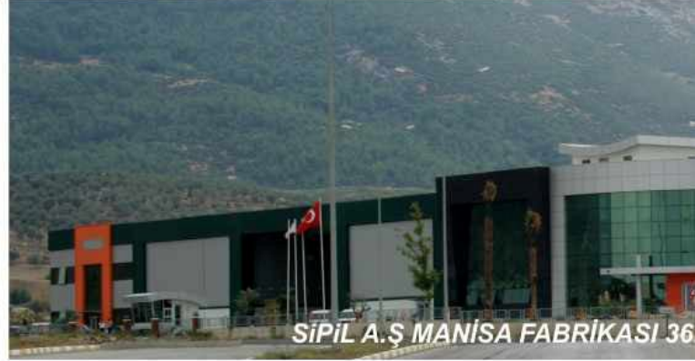
SİPİL A.Ş MANİSA FABRİKASI 36

İnsan odaklı çalışma anlamıyla mesleki ve kişisel gelişime büyük önem veren SİPİL AŞ'de bugün yılda 4000 saat eğitim seviyesine ulaşıldı. Yine aynı yaklaşım doğrultusunda kurulan İş Sağlığı ve Güvenliği