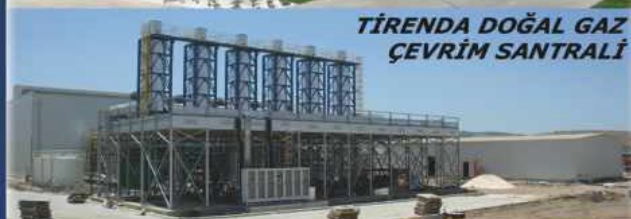
TİRENDA DOĞAL GAZ ÇEVİRİM SANTRALİ