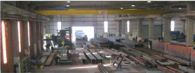
SİPİL ÇELİK 5000 Ton/Yıl üretim kapasitesiyle ulusal ve uluslararası Projelere imza atıyor.

SİPİL Enerji grubu ise SİPİL AŞ bünyesinde kurulan Ar-Ge birimiyle birlikte 2012 yılında 7 ticari ürün geliştirip piyasaya sunmak üzere çalışmalarını sürdürüyor. Güneş enerjisi ile sokak aydınlatması sağlayacak ilk ürün TRİTON SGS1'in deneme çalışmalarına başlandı.