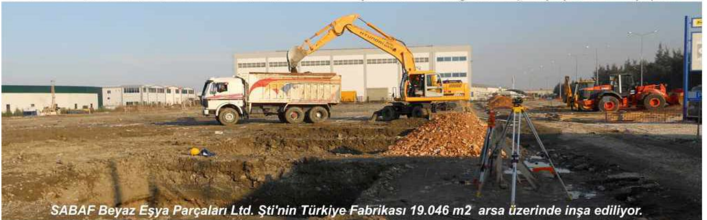
SABAF Beyaz Eşya Parçaları Ltd. Şti'nin Türkiye Fabrikası 19.046 m 2 arsa üzerinde inşa ediliyor.

SABAF Beyaz Eşya Parçaları Ltd.Şti. yetkilileri, proje yönetim kontrol grubu ve şantiye yönetimi ile yapılan