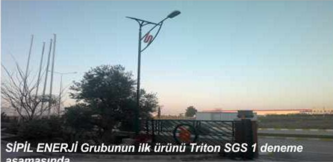
SİPİL ENERJİ Grubunun ilk ürünü Triton SGS 1 deneme aşamasında

SİPİL Enerji grubu ise SİPİL AŞ bünyesinde kurulan Ar-Ge birimiyle birlikte 2012 yılında 7 ticari ürün geliştirip piyasaya sunmak üzere çalışmalarını sürdürüyor. Güneş enerjisi ile sokak aydınlatması sağlayacak ilk ürün TRİTON SGS1'in deneme çalışmalarına başlandı.