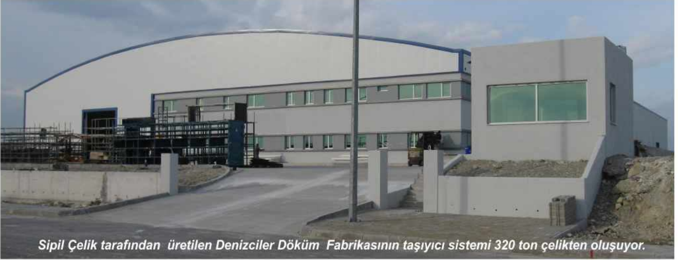
Sipil Çelik tarafından üretilen Denizciler Döküm Fabrikasının taşıyıcı sistemi 320 ton çelikten oluşuyor.

Denizciler Döküm Firmasının Aliağa Organize Sanayi Bölgesi'nde 25.008 m 2 arsa üzerine 6.808 m 2 kapalı alandan oluşan fabrika ve yönetim binası inşaatı şantiye şefi inşaat mühendisi Sedat Yetim, yardımcısı inşaat teknikeri Engin Koçak, formen Yusuf Traş, proje uygulama sorumlusu mimar İnanç Gürkan yönetim ekibiyle iş programına uygun olarak tamamlanarak geçici kabulü yapıldı.