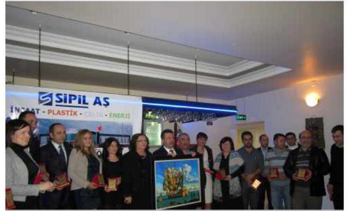
SİPİL A.Ş. 28. Kuruluş Yıldönümünde hizmette 5. ,10. ,15. ve 20. Onur yıllarını dolduran idari personele plaketleri dağıtıldı.

SİPİL A.Ş. 28. Kuruluş Yıldönümünü Yönetim Kurulu üyeleri, Mali Müşavir, Hukuk Müşaviri ve 54 idari personelin katılımıyla 21 Ocak 2012 tarihinde Manisa'da gerçekleştirilen yemekli toplantıda kutladı.