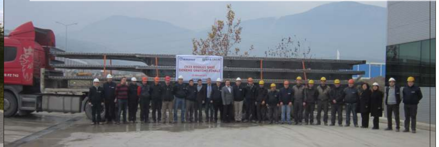
Sipil Çelik tarafından üretimi gerçekleştirilen treyler şasileri 28 Aralık 2012 tarihinde Krone-Doğuş Tire fabrikasına sevk edildi.

Dünyanın önde gelen treyler üreticilerinden Alman Krone markası Doğuş Otomotiv ile birlikte Tire Organize Sanayi Bölgesi'ndeki fabrikalarında treyler üretiyor. KRONE-DOĞUŞ fabrikasında üretilen treylerde kullanılan şasi tedariki için uzun zamandır hazırlık çalışmaları yapan SİPİL ÇELİK Manisa fabrikasında sürdürdüğü deneme üretimlerini tamamladı.