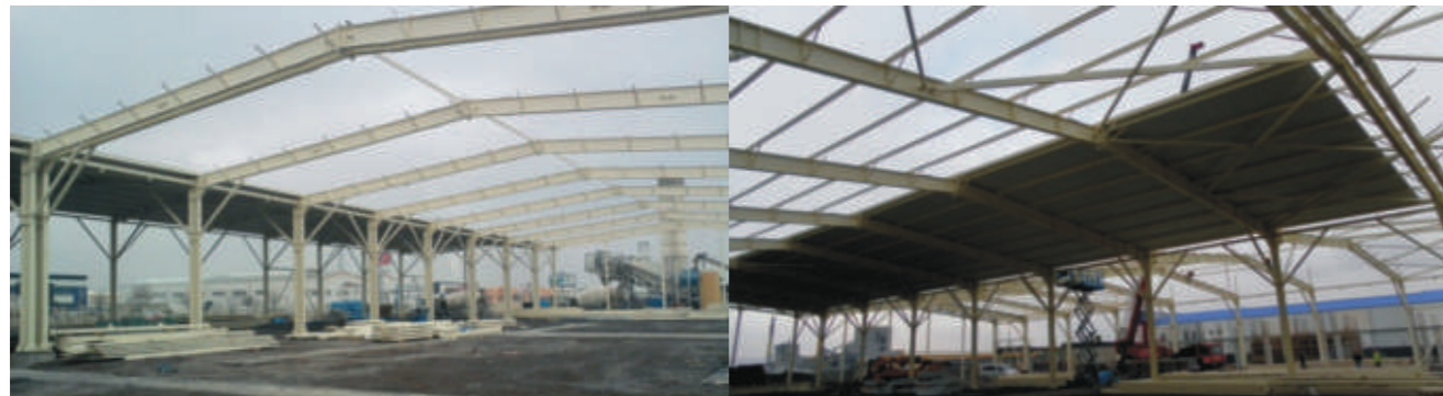
Orta Anadolu iplik üretim tesisleri taşıyıcı sistemi komple çelik yapıdan oluşmaktadır. İmalat ve montajı Sipil Çelik grubunca gerçekleştirilmiştir.

2.Etapta ise 10.11.2012 tarihinde yapı ruhsatı alınarak, betonarme klima kanalı ve temel imatlarına başlanmıştır. Bugün gelinen seviyede ise toplam 2 km. uzunluğundaki