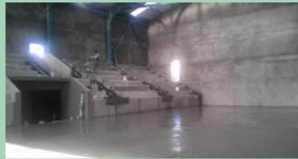
Kapalı Spor Salonu 300 seyirci kapasiteli ve profesyonel standartlarda basketbol ve voleybol sahasına sahip olacaktır.