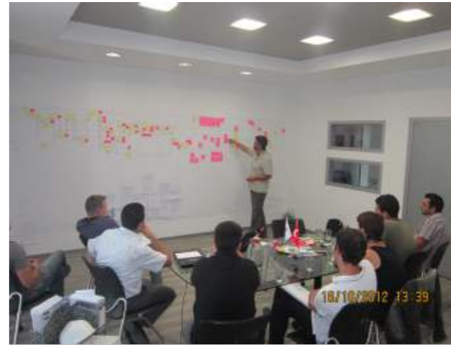
Sipil Çelik grubunda Yalın Üretim Çalışmaları 3 ay boyunca sürdürülmüştür.

Çalışma dönemi sonunda etkin yerleşim planı ve makigami (üretim akışı) diyagramı oluşturulmuştur. Bu dönemde çalışmalarımıza yön veren ve destek olan Nar Danışmanlık firması uzmanları Emre Göktepe ve Filiz Güler'e teşekkür ediyoruz.