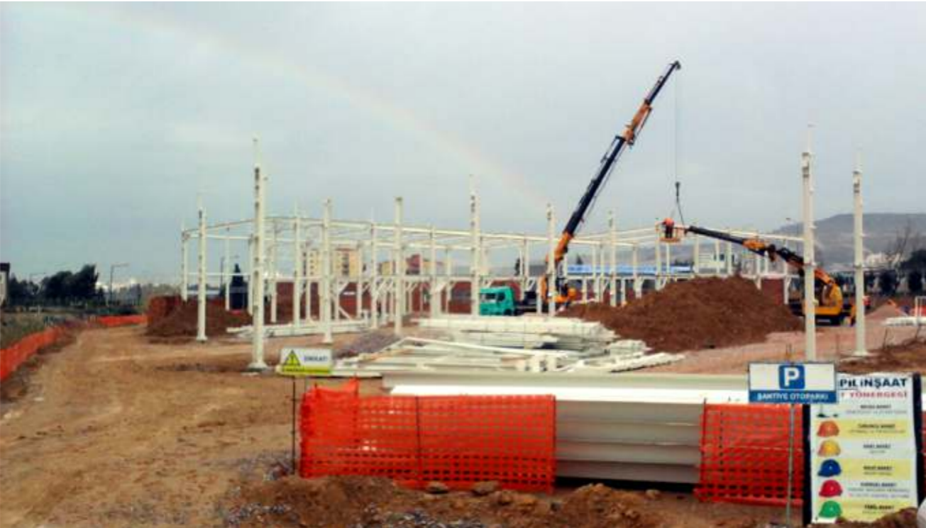
Ropix Fabrika ve idari binası ESBAŞ içerisinde 7624 m 2 parselde yer almakta ve toplam 4.000 m 2 kapalı alandan oluşmaktadır.

Sözleşmesi Ağustos ayında yapılan ve Kasım ayının başında yapımına başlanan Ropix Giyim Sanayi Fabrika ve İdari Bina inşaatı şantiye imatları hızla sürmektedir.