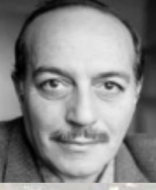
Cemal SÜREYA (1931-1990)