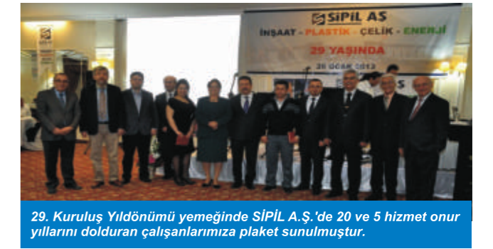
29. Kuruluş Yıldönümü yemeğinde SİPİL A.Ş.'de 20 ve 5 hizmet onur yıllarını dolduran çalışanlarımıza plaket sunulmuştur.

Yemek sonunda yönetim kurulu ve tüm idari personelin katılımıyla 29. Kuruluş Yıldönümü anısına pasta kesildi.