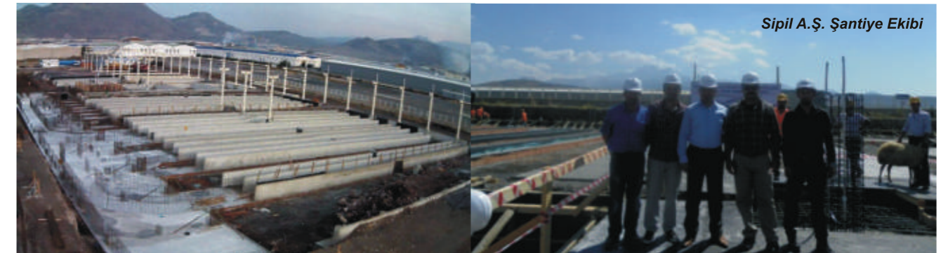
Sipil A.Ş. Şantiye Ekibi

Orta Anadolu Şantiyesinde inşaat alanında çalışan tüm yüklenici ve alt yüklenici personeline iş sağlığı ve iş güvenliği eğitimleri verilmiş olup, bu eğitimler düzenli olarak tekrarlanmaktadır.