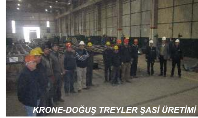
KRONE-DOĞUŞ TREYLER ŞASI ÜRETİMİ

2012 yılının Kasım-Aralık döneminde numune şasilerin üretimi başarı ile tamamlanmıştır. 2013 yılı termin programına uygun olarak alınacak siparişler ile üretimin devam etmesi planlanmaktadır. Almanya'daki KRONE fabrikasında SİPİL Çelik üretim personeli eğitimleri bu dönemde sürdürülmektedir. Farklı tip şasi imalatları içinde ön hazırlık çalışmaları aralıksız olarak sürdürülmektedir. Otomasyon ve proses geliştirme çalışmalarına SİPİL ARGE grubu destek vermektedir. Üretimin verimliliğini arttırmak amacıyla fikstür imalatları SİPİL Çelik grubunca gerçekleştirilmektedir.