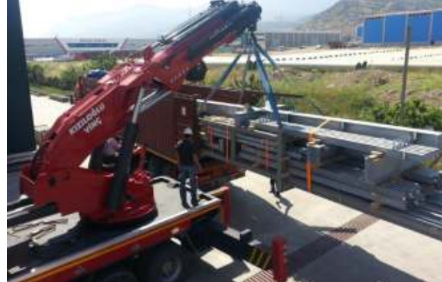
GEA Energietechnik projeleri tamamlanmış ve sevk edilmiştir.

kalitesinin mükemmel olduğu belirtilmiştir. Ürünlerin oluşturacağı enerji santrali, Fildişi sahilleri halkının 24 saat kesintisiz elektriğe kavuşmasını sağlayacaktır. Sipil Çelik de bu projede yer almanın gururunu yaşamaktadır.