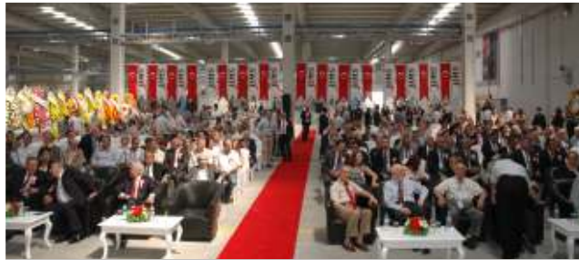
27 Mayıs 2014'te HMS Makine A.Ş. Manisa OSB'deki yeni binası için açılış töreni gerçekleşti.

Yıl 2014... Manisa Organize Sanayi Bölgesi'nde 30 milyon TL'lik yeni yatırım projesi ile 36 bin 250 m 2 alan üzerinde 22 bin m 2 kapalı alandan oluşan yeni fabrika ve idari binasına taşındı. 4 Haziran 2013 tarihinde temeli atılan ve yaklaşık 5 ay gibi kısa bir sürede Sipil Group tarafından yapımı tamamlanan tesisin açılış töreni 27 Mayıs 2014 tarihinde çok sayıda sanayicinin de katılımıyla gerçekleşti.