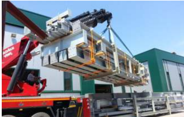
GEA Cerro Dragon projesi kapsamında çelik yapılar 35 adet konteynere yüklenerek gönderilmiştir.

Cerro Dragon projesi kapsamında 700 ton çelik imalatı sıcak daldırma galvaniz olarak imal edilmiş ve Sipil Çelik tasarımı olan konteyner yükleme aparatları ile 35 adet konteynere yüklenerek Arjantin'de Cerro Dragon şehrine gönderilmiştir. Şehir Arjantin'in güney kutbuna en yakın şehri olma özelliği taşımaktadır. Tüm kalite belgeleri hazırlanmış ve TÜV Reinland denetiminden tam not almıştır.