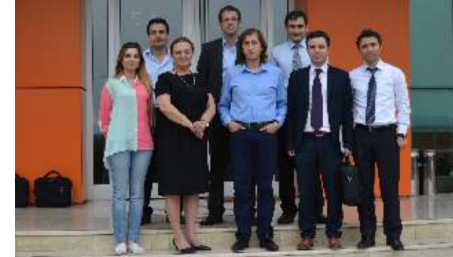
Sipil Plastik Manisa işletmesinde BSH yetkilileri denetim gerçekleştirmiştir.

Mevcut Müşteri denetimleri de 2014 yılında yoğun şekilde devam etmiştir. Bilindiği üzere Eskişehir İşletmemiz 2013 yılı sonunda Vaillant Group Denetiminden geçer puan olarak çalışmaya başlamıştı. Ağustos ayında yapılan 3. denetim sonucu puanını yükseltmiştir.