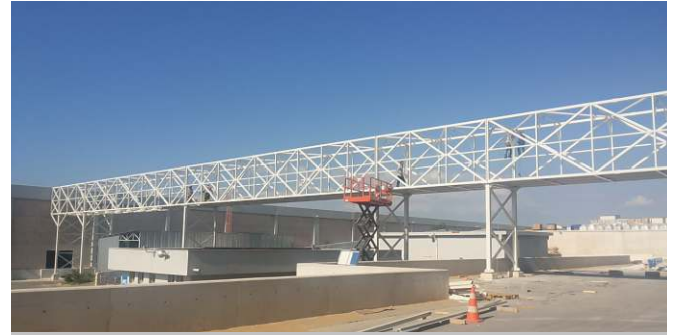
İndesit Çamaşır Makinesi Fabrikası'nın tüm çelik yapı sistemlerinin imalat ve montajı Sipil Çelik Grubunca tamamlanmıştır.