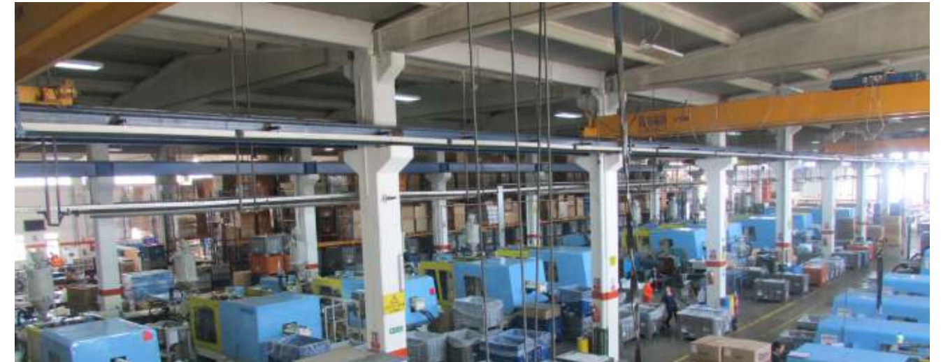
Sipil Plastik Eskişehir işletmesi iş programına uygun olarak üretimi kesintisiz sürdürüyor.

Yıl sonuna kadar Manisa ve Eskişehir işletmelerinin tüm makinalarında dozajlama üniteleri adım adım tamamlanacaktır.