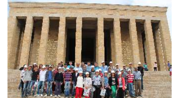
07 Haziran 2014 tarihinde 8. sınıf öğrencilerini Ankara Gezisine göndermişler ve Çanakkale'den Ankara'ya ulaşan tarihsel süreci de tamamlamışlardır.