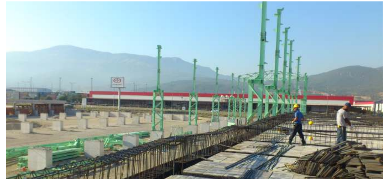
Erdemir Çelik servis merkezi betonarme imalatları iş programının önünde sürdürülmektedir.