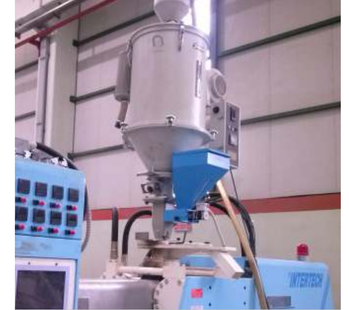
Sipil Plastik ve AR-GE Grubumuzca yapılan dozajlama üniteleri Manisa ve Eskişehir işletmelerinde hizmete girmiştir.

Sipil Plastik Grubu'nda ayrıca iyileştirme ve AR-GE faaliyetleri doğrultusunda kalıp şartlandırıcı ve dozajlama ünitesi yapım çalışmalarına başlanmıştır. Manisa işletmemizde 17 adet dozajlama ünitesi, Eskişehir işletmemizde 11 adet dozajlama ünitesi ve her iki işletmede ise 4'er adet kalıp şartlandırma yapımı tamamlanarak hizmete alınmıştır.