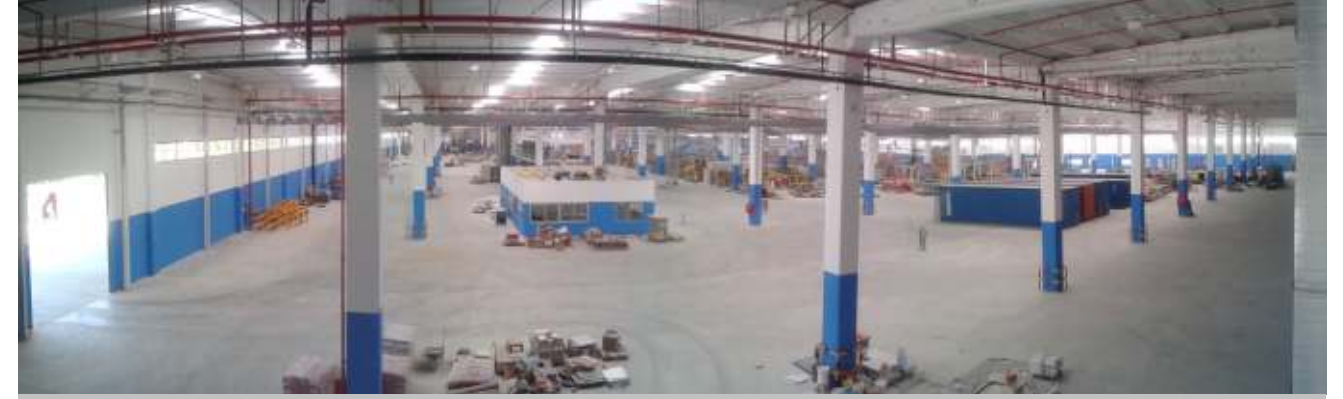
Indesit Company Çamaşır Makinesi fabrika ve idari binası 4 Ağustos 2014 tarihinde tüm yardımcı tesis, ekipman ve idari binası kullanılmaya başlanılmıştır.

6 Kasım 2013 tarihinde yapı ruhsatı alınarak betonarme temel imalatlarına başlanılmış ve 4 milestone dan oluşan sözleşmede belirtilen teslim tarihleri iş programı öncesinde gidilerek işverene teslim edilmiş ve sözleşmede belirtilen tarihten 1 ay öncesinde oturma izni alınmıştır. Yaklaşık 250 bin m 2 alan ile MOSB deki en büyük 2. parsel konumunda olan Indesit şantiyesinde Çamaşır Makinesi inşaatı yanında, yaklaşık bin m 2 kapalı alana sahip olan tamamı çelik konstrüksiyon tasarlanmış hurda ayrıştırma binası, yeni güvenlik binası ve yaklaşık 10 bin m 2 alana sahip otopark ve giriş düzenlemesi, güvenlik binasından çamaşır makinesi ve buzdolabı fabrikasına ulaşımı sağlayan üstü tamamen kapalı yaklaşık 200 metre uzunluğa sahip yürüme yolları, mevcut yemekhane binası yanında yapılan yaklaşık 600 m 2 alana sahip yeni yemekhane binası, Çamaşır Makinesi fabrikasında bitmiş ürünlerin lojistik depoya sevkini sağlayan yaklaşık 78 metre uzunluğa sahip transportasyon tüneli