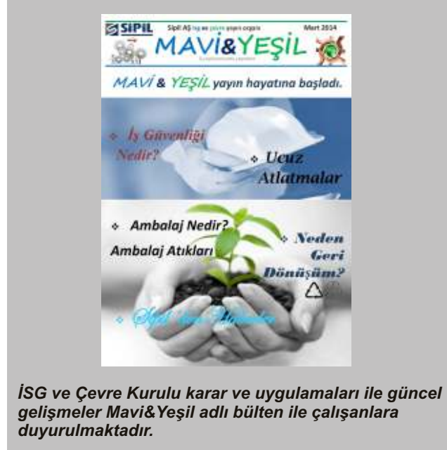
İSG ve Çevre Kurulu karar ve uygulamaları ile güncel gelişmeler Mavi&Yeşil adlı bülten ile çalışanlara duyurulmaktadır.

İSG kurulu ve çevre kurullarına katılan çeşitli birimlerden çalışanlar ile kurul gündemlerinin farklı ve değişik açılardan irdelenmesi kurumsal kimlik anlayışının artırılması açısından da önemli bir değer oluşturmaktadır.