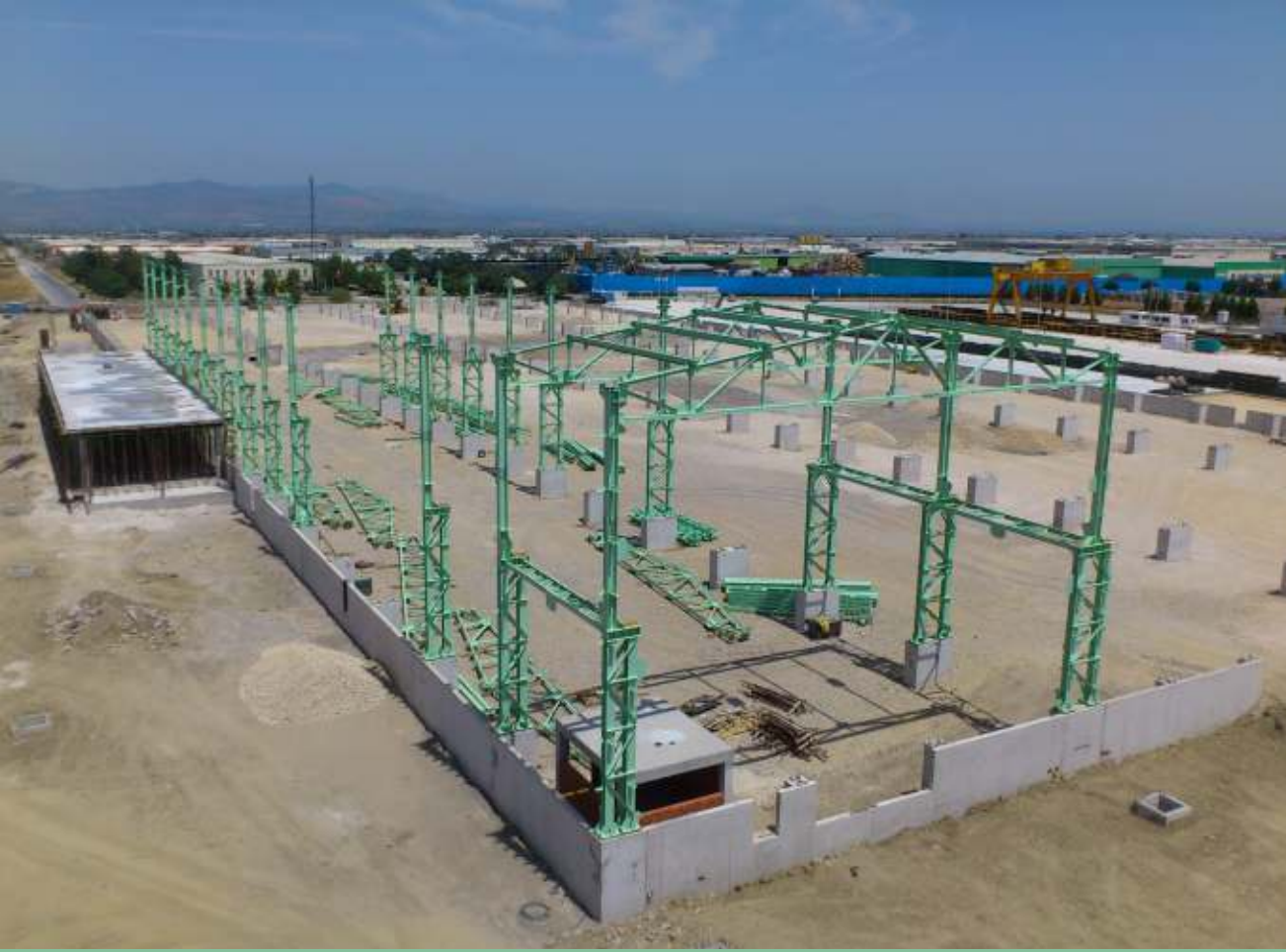
Erdemir Manisa Çelik Servis Merkezi çelik yapı imalatı ve montajı Sipil Grubu'nca gerçekleştirilmektedir.

ERDEMİR Grubu, başta otomotiv ve beyaz eşya sektörlerinin ihtiyaç duyduğu ebatlanmış yassı çelik konusunda müşterilerine daha iyi hizmet sunabilmek için Çelik Servis Merkezi ağını genişletmeye devam ediyor.