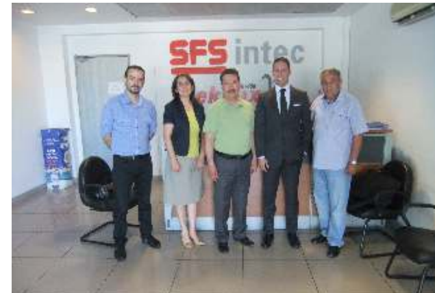
SFS Depaks yeni ek bina inşaatı ve mevcut bina renovasyonu işleri için 11 Haziran 2014'te sözleşme imzalandı, Temmuz 2014'te mobilizasyon çalışmaları başladı.

Toplam 6 bin 200 m 2 kapalı alandan oluşacak olan yeni üretim binasının taşıyıcı sistemi prefabrikattir. Limtaş Mühendislik Müşavirlik Ltd. Şti. tarafından projeleri hazırlanmış ve saha kontrollüğü de yine aynı şekilde sağlanmaktadır. Kaliteli ve hızlı imalat anlayışı ile iş güvenliğinden ödün vermeyen Sipil İnşaat çalışanlarına başarılar dileriz.