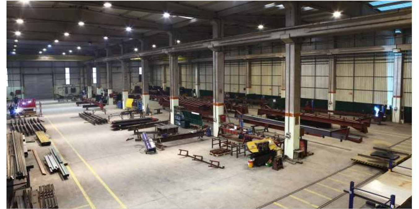
Ersem Çelik Servis Merkezi çelik yapı üretim ve montajı Sipil Çelik grubunca sürmektedir.

Makas, stabilite kirişi, cephe ve çatı aşıkları imalatları ve montajları ise proje programına uygun olarak devam etmektedir.