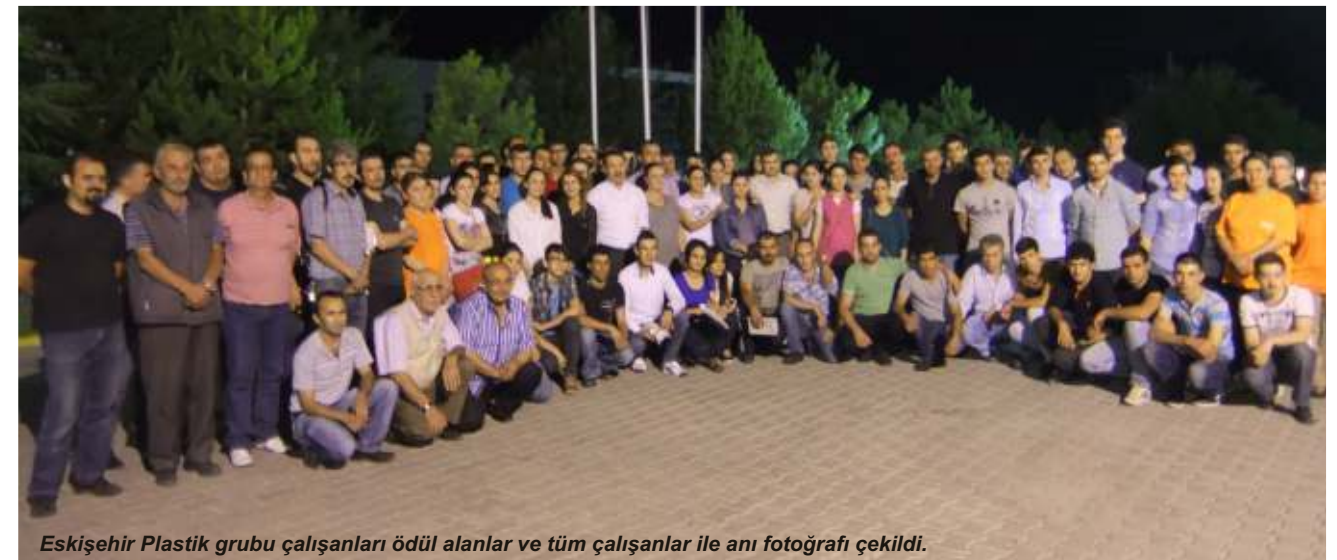
Eskişehir Plastik grubu çalışanları ödül alanlar ve tüm çalışanlar ile anı fotoğrafı çekildi.