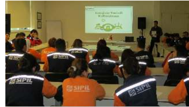
Sipil İnşaat, Plastik ve Çelik gruplarında eğitimler kesintisiz olarak sürmektedir.