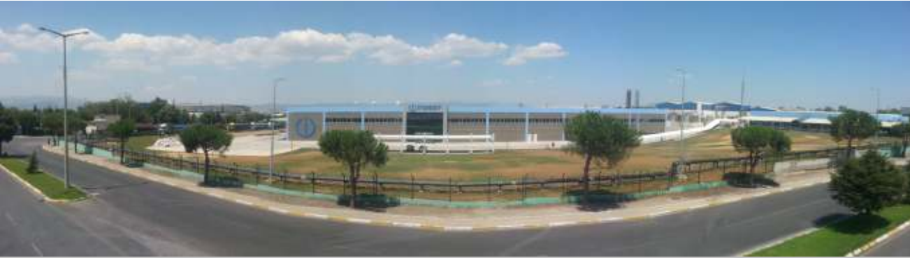
Sipil A.Ş. tarafından anahtar teslimi olarak gerçekleştirilen Indesit Company Çamaşır Makinesi Fabrikası yaklaşık 35 bin m 2 kapalı alandan oluşuyor ve MOSB 2. kısımda yer alıyor.

Türkiye'de Hotpoint ve Indesit markalarıyla beyaz eşya ve küçük ev aletleri sektöründe faaliyet gösteren Indesit Grubu, Türkiye'deki faaliyetlerine 1994 yılında MOSB'deki 100 bin adet üretim kapasiteli soğutucu fabrikasını satın alarak başlamıştır. 20 yılda yapılan yatırımlarla üretim kapasitesini 1 milyon 500 bin adede ulaştıran Indesit Company Manisa Soğutucu Fabrikası, üretimin yüzde 80'ini Avrupa, Ortadoğu ve Orta Asya'ya ihraç eder durumdadır. Soğutucu üretiminin yanında Indesit Manisa'da kurulu olduğu alan içinde yaklaşık 55 bin m 2 alan içinde 35 bin m 2 kapalı alandan oluşan çamaşır makinesi fabrikası yatırımı ise yaklaşık 35 milyon Euro yatırım bedeli ile tamamlanmıştır. Böylece Indesit, Manisa'da soğutucu fabrikası, lojistik deposu ve çamaşır makinesi fabrikası ile toplamda 124 bin m 2 kapalı alanda faaliyet gösteriyor olacaktır. Dünya üzerinde sekiz sanayi merkezinde (İtalya, Polonya, İngiltere, Rusya ve Türkiye) üretimine devam eden Indesit Company, Indesit Hotpoint ve SCHOLTES markalarıyla sektördeki haklı yerini korumaktadır. Dünya genelinde 16 bin çalışanı ile hizmet veren şirket her geçen gün büyüme hızını artırmaya devam etmektedir.