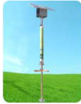
Solar Şarj İstasyonu