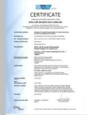
Sipil Çelik EN 1090 belgemiz yenilenmiştir.

Denetim sonucunda EN 1090 belgesi 12 Temmuz 2015 tarihine kadar yenilenmiştir.