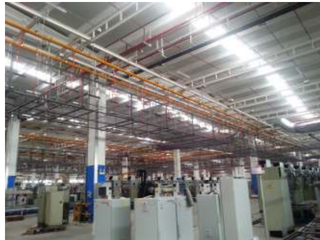
İndesit Company Çamaşır Makinesi fabrikası çelik yapı işlerini Sipil Çelik grubu tamamladı.

Sipil İnşaat tarafından anahtar teslimi olarak alınan işte, Çamaşır makinelerinin konveyör sistemi ile iki bina arasında taşıyan çelik transfer köprüsü tamamlanmış ve yerinde montajı yapılmıştır. Ayrıca fabrika içi havai yürüme yollarının karkasları ve fabrika giriş kanopisi imalatları ve montajı kısa sürede tamamlanıp teslim edilmiştir.