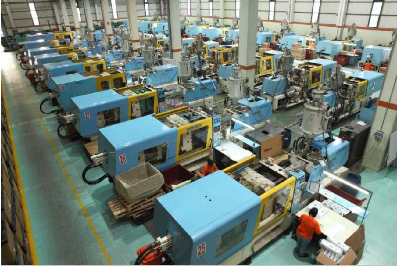
Sipil Plastik Manisa işletmesi ürün ve hizmet alanını yeni anlaşmalarla genişletiyor.

Sipil Plastik 1996 yılında hobi olarak başlayan yolculuğuna; yılların verdiği tecrübeyle dev firmaların tedarikçisi olmaya devam etmektedir.