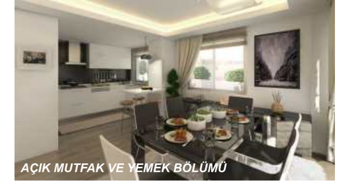
AÇIK MUTFAK VE YEMEK BÖLÜMÜ

Satışları devam eden daireler hakkında ayrıntılı bilgi için Mimari Proje ve Uygulama Sorumlusu Ezgi Bayraktar (GSM 0530 772 48 14) ile irtibata geçilebilmektedir. Modern ve kullanışlı yaşam alanları oluşturulan apartman iç hacimlerde kalitenin yanında konfor elde edilmiştir.