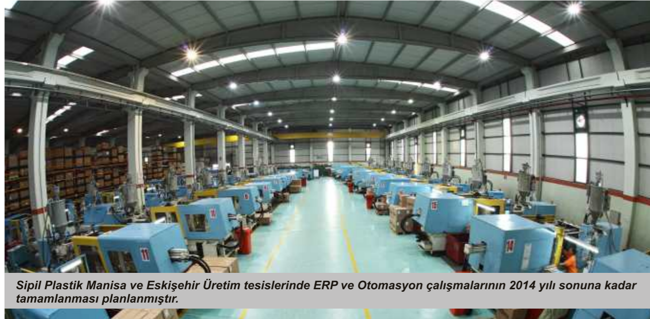
Sipil Plastik Manisa ve Eskişehir Üretim tesislerinde ERP ve Otomasyon çalışmalarının 2014 yılı sonuna kadar tamamlanması planlanmıştır.

Sipil Group Plastik İşletmeleri ağırlıklı olarak Beyaz Eşya Yan Sanayi olarak hizmet vermektedir. Beyaz Eşya Sektörünün öncüleri olan Arçelik, Indesit ve Vestel gibi firmaların yanında kendi sektörlerinin dev firmaları olan Vaillant Demirdöküm, ECA, Schneider Electric ve Klimasan gibi firmalara da Manisa ve Eskişehir İşletmelerinde Plastik Enjeksiyon Yan Sanayi olarak hizmet vermektedir. Plastik İşletmelerinde 2014 yılındaki hedef iş hacmini geçen yılın üzerine çıkartarak ayda 600 ton hammadde işlemektir.