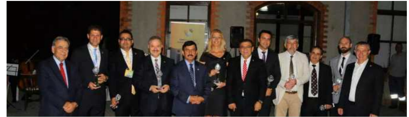
İSG Zirvesi Organizasyon Komitesi üyelerine İzmir milletvekilleri Alaattin Yüksel, Mustafa Moroğlu ve İBŞB Başkanı Aziz Kocaoğlu plaket sundu..

Meslek lisesi, meslek yüksek okulları ve üniversitelerde ise iş güvenliği alanında teknik ve sağlık personelinin sayısının artırılması amacıyla bölümler açılması zorunluluğu vurgulanmıştır.