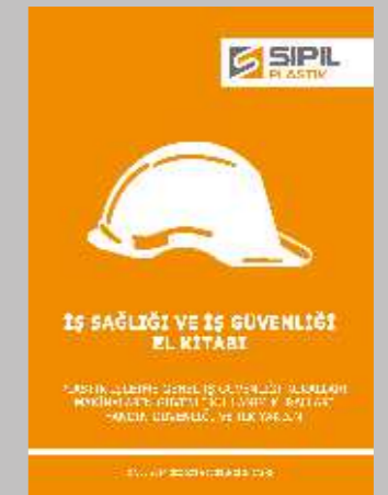
Sipil Plastik İSG el kitabı gözden geçirilmiş yeni baskısı yayımlandı.

meydana gelen iş kazaları ve ramak kala kaza tutanakları tek tek incelenmiştir. İnceleme sonucunda her kaza ve tutanağa bağlı kök nedenler tespit edilmiş, çözüm önerileri üretilmiştir. Ayrıca Plastik, Çelik ve İnşaat gruplarının yeni mevzuata göre düzenlenen İSG el kitaplarının basımı kararlaştırılmıştır. Bültenimizin baskıya girdiği günlerde Sipil Plastik İSG el kitabı yayımlanmış ve tüm çalışanlarına dağıtılmıştır.