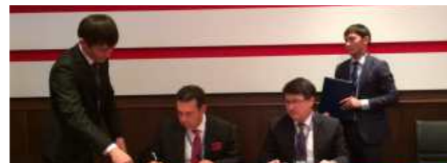
Sipil Group ve Kızılorda Vilayet Makamı arasında 30 Ekim 2014 tarihinde Memorandum imzalandı.

SİPİL INDUSTRY'nin Kazakistan'da İnşaat, Çelik, Plastik ve Enerji sektörlerinde faaliyette bulunması amaçlanıyor. Sipil Group 30 yıllık birikim ve deneyimini SİPİL INDUSTRY'e taşıyarak Kazakistan başta olmak üzere uluslararası platformda bir çok önemli projeye imza atmayı hedefliyor.