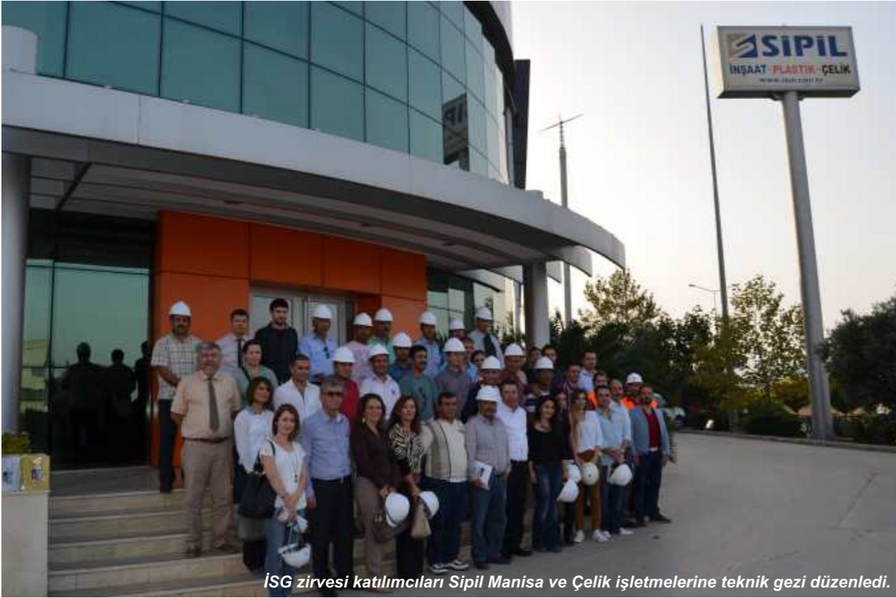
İSG zirvesi katılımcıları Sipel Manisa ve Çelik işletmelerine teknik gezi düzenledi.

İZSİAD ve AArtı OSGB tarafından düzenlenen İzmir İş Sağlığı ve Güvenliği Zirvesi ve Fuarı 16-17-18 Ekim 2014 tarihlerinde Tepekule Kongre ve Sergi Merkezi'nde gerçekleştirildi.