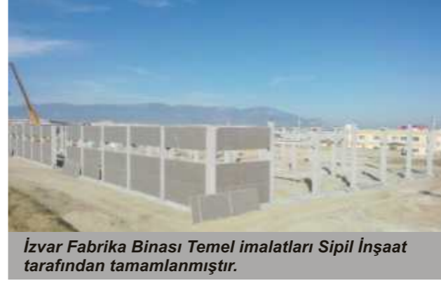
İzvar Fabrika Binası Temel imalatları Sipil İnşaat tarafından tamamlanmıştır.