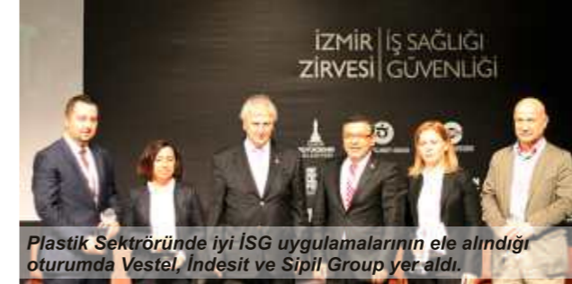
Plastik Sektöründe iyi İSG uygulamalarının ele alındığı oturumda Vestel, İndesit ve Sipel Group yer aldı.

tarafından açılan standlarda İSG alanındaki ürün ve hizmetler ziyaretçilere tanıtıldı. 2000'e yakın mühendis, mimar, doktor, hemşire, teknik eleman, üniversite, meslek yüksek okulu ve meslek lisesi öğrencisi tarafından ziyaret edilen fuar alanındaki ihtisas fuarları arasında gördüğü yoğun ilgiyle şimdiden ön sıralardaki yerini aldı.