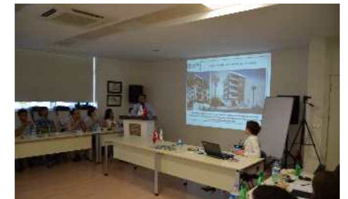
2014 yılı Yönetim Gözden Geçirme 2 Toplantısı 13 Eylül 2014 tarihinde gerçekleşti.

Bunların yanında Kalite Yönetimi ve Satınalma birimlerince tedarikçilerin denetlenmesi, İnsan Kaynakları biriminde kişi başı eğitim programları, İşkur-SGK teşvik programlarından yararlanılması gibi konular gündeme getirildi ve kararlar alındı.