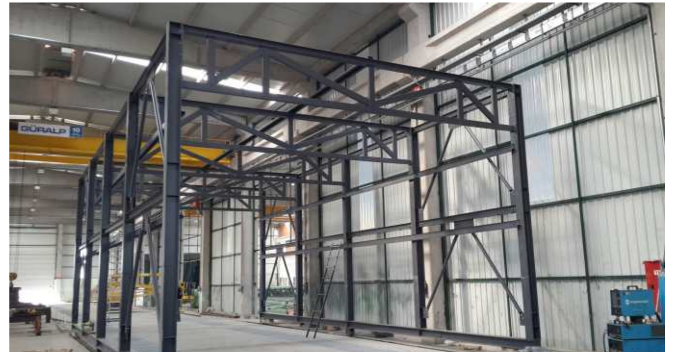
Sipil Çelik'te kalite ve verimliliği arttırmaya yönelik yatırımlar devam ediyor. Bu kapsamda yatırım planına alınan hareketli boya ünitesi montaj çalışmaları sürüyor.

Alman Ammann Elba firması beton mikserleri ve inşaat sektörüne verdiği hizmetlerle dünya lideri olma yolunda ilerlemektedir. Bu sebeple Ortadoğu ve Afrika pazarına açılmak için kendilerine üretim partneri olarak firmamızı tercih etmişlerdir. Almanya Ettlingen de bulunan fabrikasında ziyaret gerçekleştirilmiş; üretim ve mühendislik detayları hakkında karşılıklı bilgi edinilmiştir. Sipil Çelik ile birlikte gerek know-how çalışmalarında gerek ise tasarım uygulamalarında beraber çalışılması planlanmaktadır. Bu sene içerisinde yapılacak numune ile birlikte seri üretime geçilmesi planlanmaktadır.