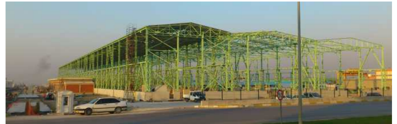
Erdemir Çelik Servis Merkezi'nin tüm çelik yapı imalat ve montaj işleri Sipil Çelik Grubu'nca gerçekleştirilmektedir.

Dış sahada bulunan alt yapı imatları yüzde 85 oranında tamamlanmış olup saha betonu dökümlerine devam edilmektedir. İş programına uygun olarak devam etmekte olan imatların yıl sonunda geçici kabul aşamasına getirilmesi planlanmaktadır. 3 bin ton çelik konstrüksiyon imalatı yapılacak olan fabrika binasında, imatların büyük bölümü tamamlanmış bulunmaktadır. ERSEM ve ERENCO yetkilileri ile yapılan düzenli koordinasyon toplantıları ile teknik konular gündeme alınarak karar altına alınmaktadır. ISO9001 kalite yönetim sistemine, ISO18001 iş güvenliği yönetim sistemine, ISO14001 Çevre yönetim sisteminin gerektirdiği şartlar ve iş programına uygun olarak çalışmalar sürdürülmektedir. ISG kurul kararları doğrultusunda işbaşı yapan tüm personele gereken eğitimler verilmektedir.