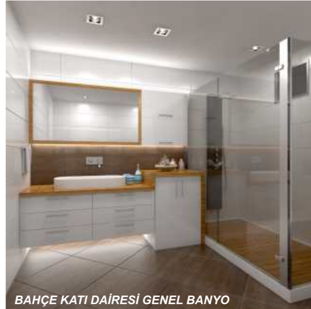
BAHÇE KATI DAİRESİ GENEL BANYO