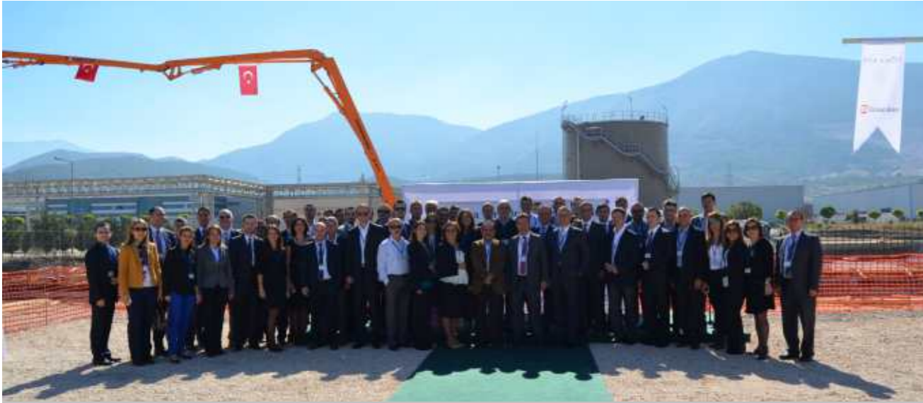
20 Ekim 2014 tarihinde İpek Kağıt (KM4) Üretim Tesisi Temeli atıldı. İpek Kağıt ve Sipil Group yönetici ve çalışanları bir arada anı fotoğrafı çekildiler.

Eczacıbaşı Topluluğu tarafından 1969 yılında çağdaş ve sağlıklı bir yaşamın gereği olan temizlik ürünlerini üretmek ve kullanımını yaygınlaştırmak amacıyla kurulan İpek Kağıt, Yalova Altınova'daki fabrikasında 1970 yılında faaliyete geçmiştir. İpek Kağıt, mendil sözcüğüyle özdeşleşmiş olan Selpak Markası, tüketicilerin farklı beklentilerini karşılayan Solo, Silen ve Servis markaları; ev dışı kullanımda ise Marathon ve Selpak Professional markalarıyla kurulduğu yıldan bu yana Türkiye temizlik kağıdı pazarının lideri konumunda bulunmaktadır.