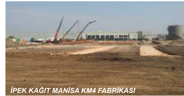
İPEK KAĞIT MANİSA KM4 FABRİKASI

bünyesinde bulunan senelerdir beraber işlere imza atmış; İnşaat ve Çelik gruplarının ortak tecrübelerinden faydalanılması planlanmıştır. 2015 ortasında bitirilmesi hedeflenen şantiyede 10 farklı bina uygulaması yapılacaktır.