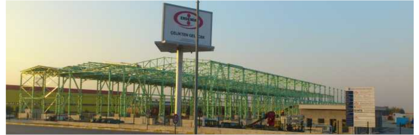
Ersem Çelik Servis Merkezi'nin 3 bin 100 tonluk proje kapsamındaki imalat ve montajları hızla devam etmektedir.

Sipil İnşaat tarafından anahtar teslimi olarak alınan yaklaşık 2 bin tonluk proje kapsamındaki imalat ve montaj çalışmalarına başlanmıştır. Kolon ve Makas birleşimlerinin tamamı yapma profil olarak imal edilecek projede, betonarme kolon ve çelik kolon olarak farklı iki inşa metodu kullanılmış ve Sipil