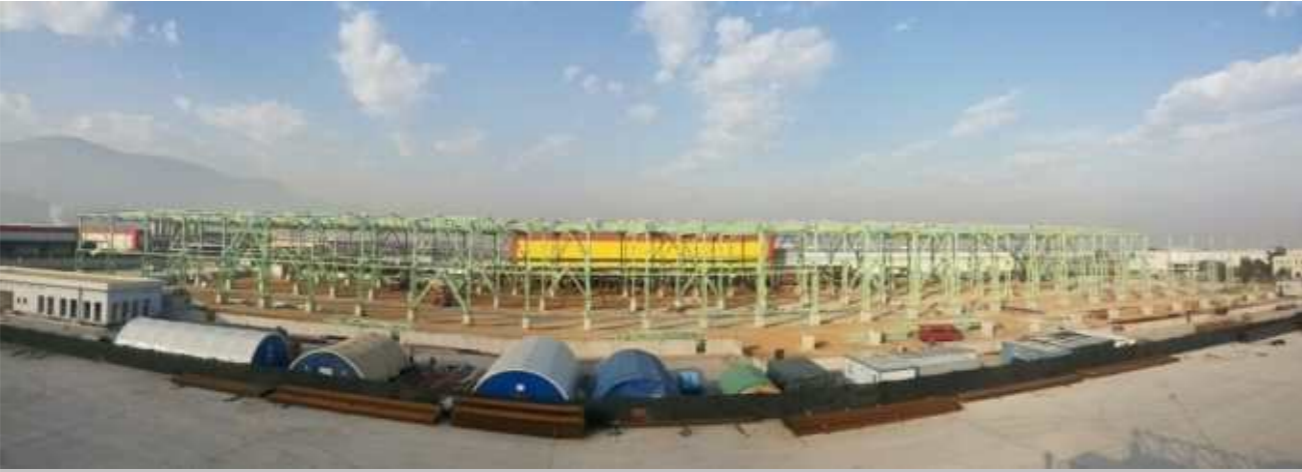
Erdemir Manisa Çelik Servis Merkezi'nin 3 bin tonluk çelik yapı imalatının önemli bir bölümü tamamlanmıştır.

Erdemir Grubu, 48 yıllık tecrübesi ve müşteri odaklı pazarlama ve satış yapılanması ile yüksek kalite beklentisine sahip, başta otomotiv ve beyaz eşya sektörlerine daha iyi hizmet verebilmek ve ürün çeşitliliğini arttırabilmek amacıyla çelik servis merkezleri ağını geliştirmeye devam ediyor.