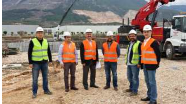
Kalite Sistem Denetimleri Manisa ve Eskişehir İşletmeleri ile İpek Kağıt şantiyesinde gerçekleşmiştir.