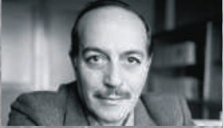
Cemal Süreyya (1931-1990)