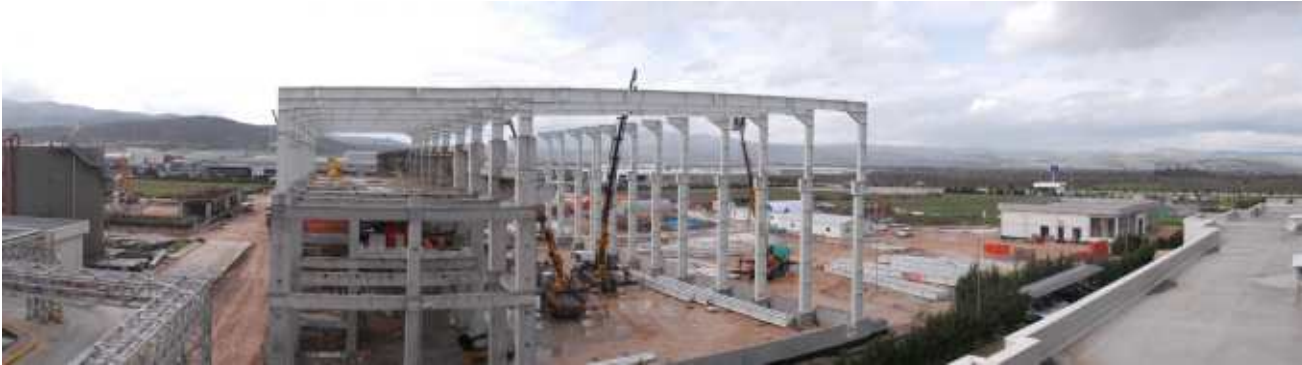
İpek Kağıt şantiyesi çelik yapı imalat ve montaj çalışmaları hızla devam ediyor.

Sipil Çelik 2014'de GEA Energietechnik firmasının Cerro Dragon-Arjantin ve Ciprel Fildişi sahilleri ile Süleymaniye ve Duhok – Irak support, Spig Vietnam imalatlarını tamamlamıştır. İndesit Çamaşır Makinesi Fabrikası, Atık Metal Parça Kontrol ve Sevk Binası montajları da 2014 yılının ilk yarısında tamamlanmıştır. İmalat ve montajı eş zamanlı olarak tamamlanan Erdemir Sac Servis Merkezi projesine başlanmış, aynı süreçte SPX Güney Afrika imalatları tamamlanmış ve son konteyner gönderilmiştir. İpek Kağıt 3. etap işleri ile ilgili çelik imalatlarına başlanmıştır. Sipil Çelik kapsamında otomatik kurutmalı hareketli boya kabini çelik imalatlarına start verilmiş ve Kasım ayında devreye alınmıştır.