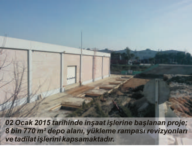
02 Ocak 2015 tarihinde inşaat işlerine başlanan proje; 8 bin 770 m 2 depo alanı, yükleme rampası revizyonları ve tadilat işlerini kapsamaktadır.

Bilindiği üzere Manisa Organize Sanayi Bölgesi 2. Kısımda yer alan Indesit Company Buzdolabı fabrikası içerisinde yaklaşık 55 bin m 2 alan içerisinde 35 bin m 2 kapalı alandan oluşan Çamaşır Makinesi Fabrika ve Yönetim Binası İnşaatı işleri 2014 yılı içerisinde, SİPİL İnşaat tarafından sözleşmeye esas süresinden 1 ay önce başarıyla tamamlanmıştır.