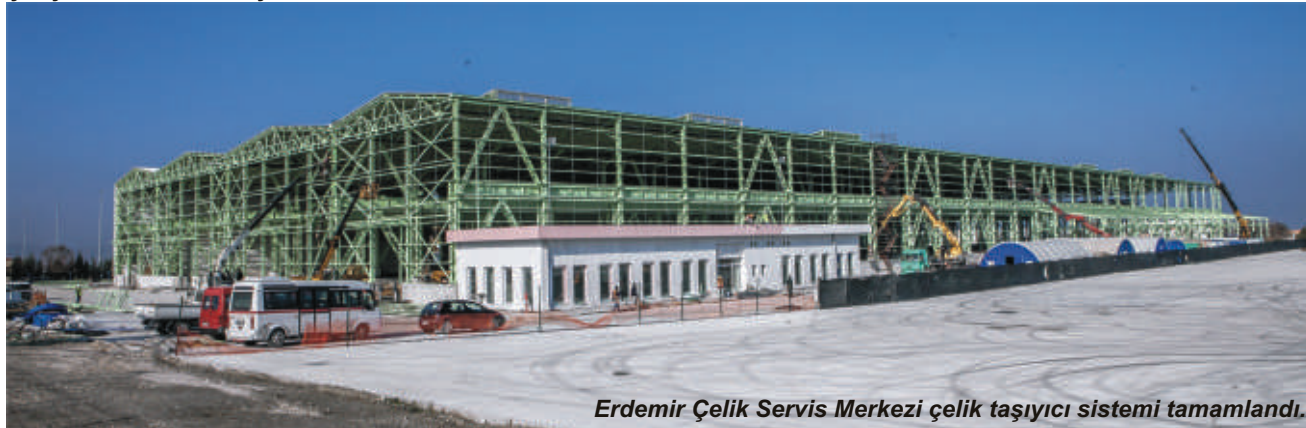
Erdemir Çelik Servis Merkezi çelik taşıyıcı sistemi tamamlandı.

Sipil İnşaat tarafından anahtar teslimi olarak alınan 3100 tonluk proje kapsamındaki imalat ve montajlar 2014 yılının ikinci altı ayında hızla sürdürülmüştür. Projenin içeriğinde yer alan kolon imalatlarındaki tüm kaynak bölgelerinin tam nufuziyetli olarak AWS D1.1'e