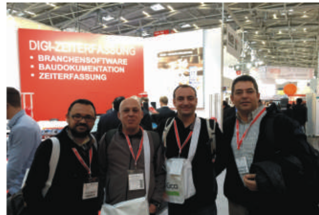
Sipil Group ulusal ve uluslararası platformlarda gerçekleştirilen kongre, sempozyum ve fuarlara katılıma devam ediyor.

Yeni hedef pazarlara ulaşmak, Sipil İnşaat ve ülkemiz özelindeki bilgi ve deneyimi küresel yapı sektörüne taşıyarak geliştirmek için 2015 yılında da anılan etkinliklere katılım sürecektir.