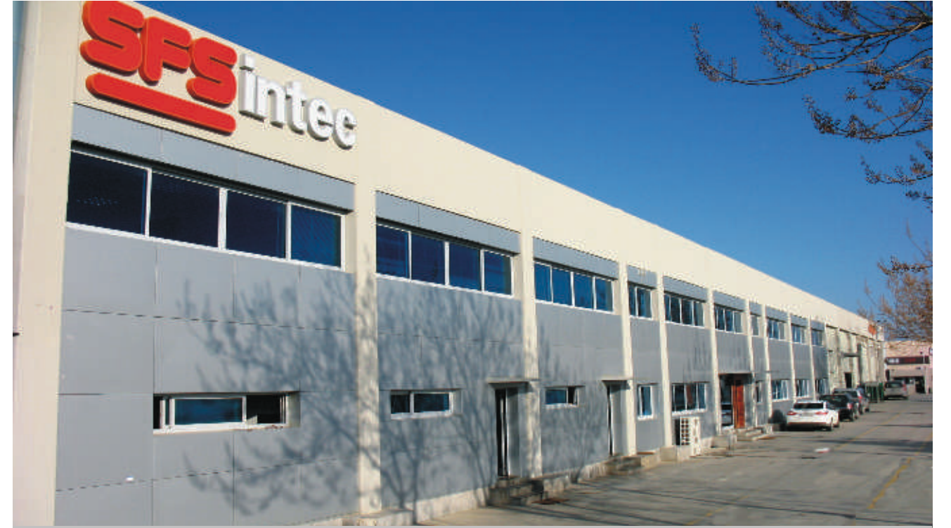
6 bin 200 m 2 kapalı alandan oluşan SFS ek bina inşaatı Aralık 2014'te tamamlanmıştır.

Türkiye'de EN ISO 9001 sertifikası ve Dekpax tescilli markası ile akıllı vida üreten tek firma olan SFS Intec firması yatırımlarına devam ediyor. Torbalıda bulunan mevcut tesislerine ek olarak "Yeni Ek Bina İnşaatı ve Mevcut Binaların Renovasyonu" inşaat işleri Sipil Group yükleniciliğinde gerçekleştirilmektedir.