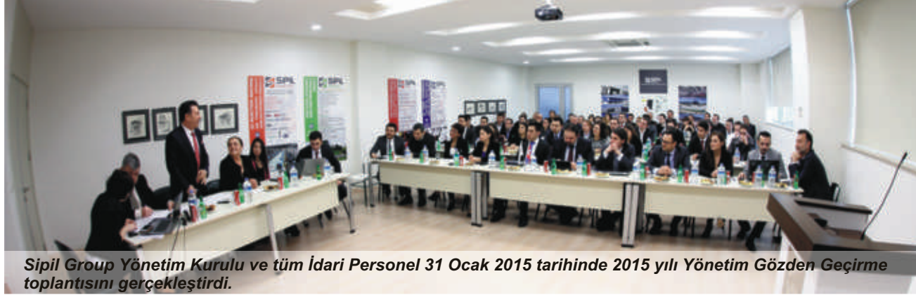
Sipil Group Yönetim Kurulu ve tüm İdari Personel 31 Ocak 2015 tarihinde 2015 yılı Yönetim Gözden Geçirme toplantısını gerçekleştirdi.

İnşaat, Plastik, Çelik ve Enerji gruplarından oluşan Sipil Group tüm idari personelin ve Yönetim Kurulu üyelerinin katılımıyla 2015 yılının ilk Yönetim Gözden Geçirme (YGG) toplantısını 31 Ocak 2015 tarihinde Manisa Plastik İşletme eğitim salonunda gerçekleştirdi. 70 katılımcının bulunduğu toplantı 09:30-18:45 saatleri arasında yapıldı. Toplantıda 13 birim yöneticisi ve danışmanın sunumları gerçekleştirildi. Her sunum ardından katılımcıların görüş, öneri ve değerlendirmeleriyle sunumlara son şekli verilmiştir. Slayt ve video gösterimleri ile zenginleşen sunumlarda ilk aşamada 2014 yılı çalışmaları ele alınmış ve gerçekleşme oranları irdelenmiştir.