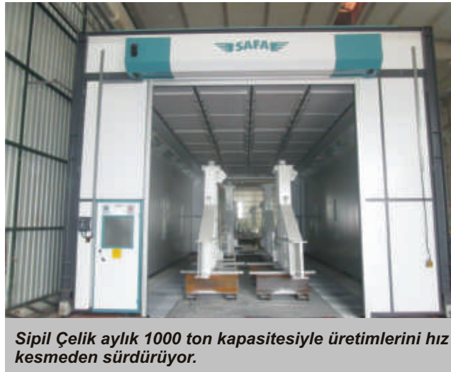
Sipil Çelik aylık 1000 ton kapasitesiyle üretimlerini hız kesmeden sürdürüyor.

Ayrıca bu dönemde bünyesine 7 adet tavan vinci, 1 adet delik delme makinası eklemiştir. Yalın Üretim ve Yönetim organizasyonu çerçevesinde GYS (Günlük Yönetim Sistemi) uygulamasına başlanmıştır. Bu uygulama sayesinde her gün birbirleriyle iletişime geçen tüm personelin uyum içerisinde ve iş odaklı çalışması hedeflenmiştir.