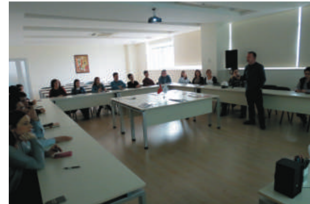
Sipil Group'ta 2014 yılında da Manisa Eskişehir Fabrikalarında ve şantiyelerde çalışanlara, tedarikçilere ve tüm iş ortaklarına iş sağlığı ve iş güvenliği konusunda eğitimler gerçekleştirildi.

2015 yılında benzer anlayışla tüm birimlerden gelen görüş ve öneriler dikkate alınarak oluşturulacak plan ve programına uygun olarak eğitim çalışmaları kesintisiz olarak sürdürülecektir.