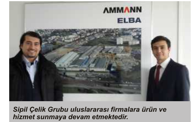
Sipil Çelik Grubu uluslararası firmalara ürün ve hizmet sunmaya devam etmektedir.

Alman Ammann Elba firması beton mikserleri ve inşaat sektörüne verdiği hizmetlerle dünya lideri olma yolunda ilerlemektedir. Bu sebeple Ortadoğu ve Afrika pazarına açılmak için kendilerine üretim partneri olarak firmamızı tercih etmişlerdir. Almanya Etlingen'de bulunan fabrikasında ziyaret 2. kez gerçekleştirilmiş, üretim ve mühendislik detayları hakkında yeni projeler ve tasarımlar kapsamında planlamalar paylaşılmıştır. Sipil Çelik ile birlikte "know-how" çalışmalarında, tasarım uygulamalarında beraber çalışılması için gerekli tarihlerde anlaşılmıştır. Bir adet numune başarıyla gerçekleştirilmiş ve denetimlerden tam not almıştır. Seri imalat için siparişler verilmiş ve 2015 yılı ilk yarısında gerçekleştirilecektir.