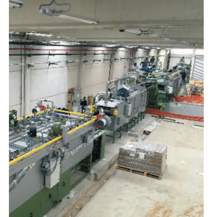
SFS ek binasında makine montaj çalışmalarına başlanmıştır.

Şantiye Şefi Ferhad Elele, Proje ve Uygulama Sorumlusu Kerem Şenoğlu'na teşekkür ederiz.