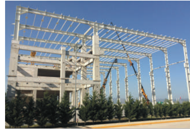
KM 4 Binasının çelik taşıyıcı sistemlerinin 29-21 aksı Sipil Çelik Grubunca imalatı ve montajı gerçekleştirilmiştir. Diğer imalatlar iş programına uygun bir şekilde sürmektedir.