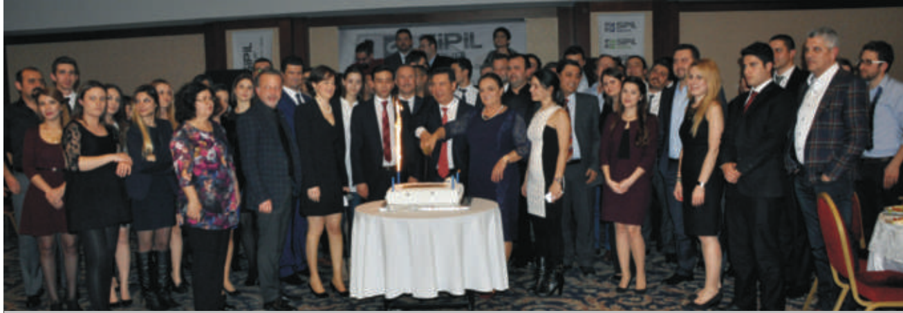
31. kuruluş yıldönümü pastası Yönetim Kurulu ve çalışanlar tarafından iyi dileklerle hep birlikte kesildi.

İnşaat, Plastik, Çelik ve Enerji Gruplarından oluşan Sipil Group 31 Ocak 2015 tarihinde Yönetim Gözden Geçirme toplantısı ardından Anemon Otel'de gerçekleştirdiği yemekte 31. Kuruluş yıldönümünü kutladı. Yönetim Kurulu üyeleri, tüm idari personel ve eşlerinin katılımıyla gerçekleştirilen yemekte açılış konuşmasını Yönetim Kurulu Başkanı Hakkı Bayraktar gerçekleştirdi. Hakkı Bayraktar sözlerine "19 Ocak 1984'ten bugüne 31 yıldır süren bir yolculuğun içindeyiz. 2007 yılının Eylül ayından bugüne kesintisiz bir yatırım ve büyüme sürecindeyiz. Bugün yaptığımız değerlendirme ve gözden geçirme toplantısında, gerçekleştirdiğimiz bu yatırımların ardından 2015'i "Kalınma ve Verimlilik" yılı ilan ettik diyerek başladı.