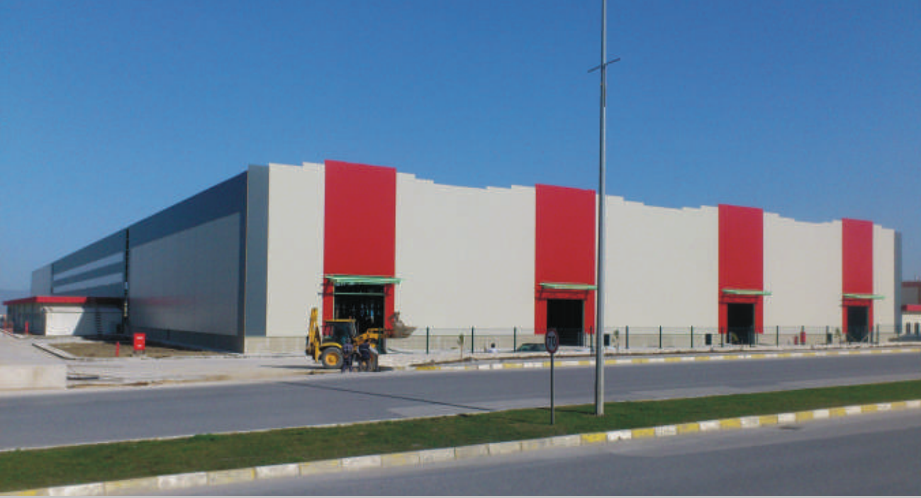
Erdemir Çelik Servis Merkezinin tüm çelik yapı üretimleri ve montajı Sipil Çelik tarafından gerçekleştirilmiş ve Aralık 2014 sonunda tamamlanmıştır.

ERDEMİR Grubu, 48 yıllık tecrübesi ve müşteri odaklı pazarlama ve satış yapılanması ile yüksek kalite beklentisine sahip, başta otomotiv ve beyaz eşya sektörlerine daha iyi hizmet verebilmek ve ürün çeşitliliğini arttırabilmek amacıyla çelik servis merkezleri ağını geliştirmeye devam etmektedir.