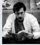
Adnan Yücel (1953-2002)

Kısacası o yıllarda ben Hayatım karışık çantam gibi İki kişiyi birden severdim Karnemde sevinç bir aşk iki