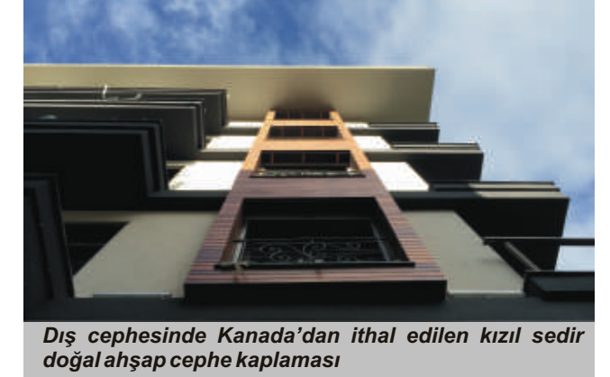
Dış cephesinde Kanada'dan ithal edilen kızıl sedir doğal ahşap cephe kaplaması

daireysel pervaz ve lake kanatlı iç kapılar, mutfaklarda ise Franke marka akrilik mutfak tezgahı ve Teka marka ankastre ürünler yer alıyor.