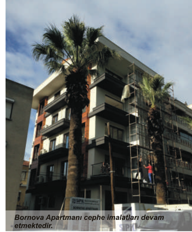
Bornova Apartmanı cephe imalatları devam etmektedir.

İzmir Bornova'da Sipil Group yatırımı olarak başlamış olan konut inşaatının Şubat ayı sonunda tamamlanması hedefleniyor. Sakinlerine modern ve kullanışlı yaşam alanları sunan projede; butik tasarım anlayışıyla her detaya önem vererek maksimum fonksiyonellik sağlanmış, minimal tasarım anlayışıyla güncel teknolojileri buluşturarak üst düzey bir yaşam standardı yakalanmıştır.