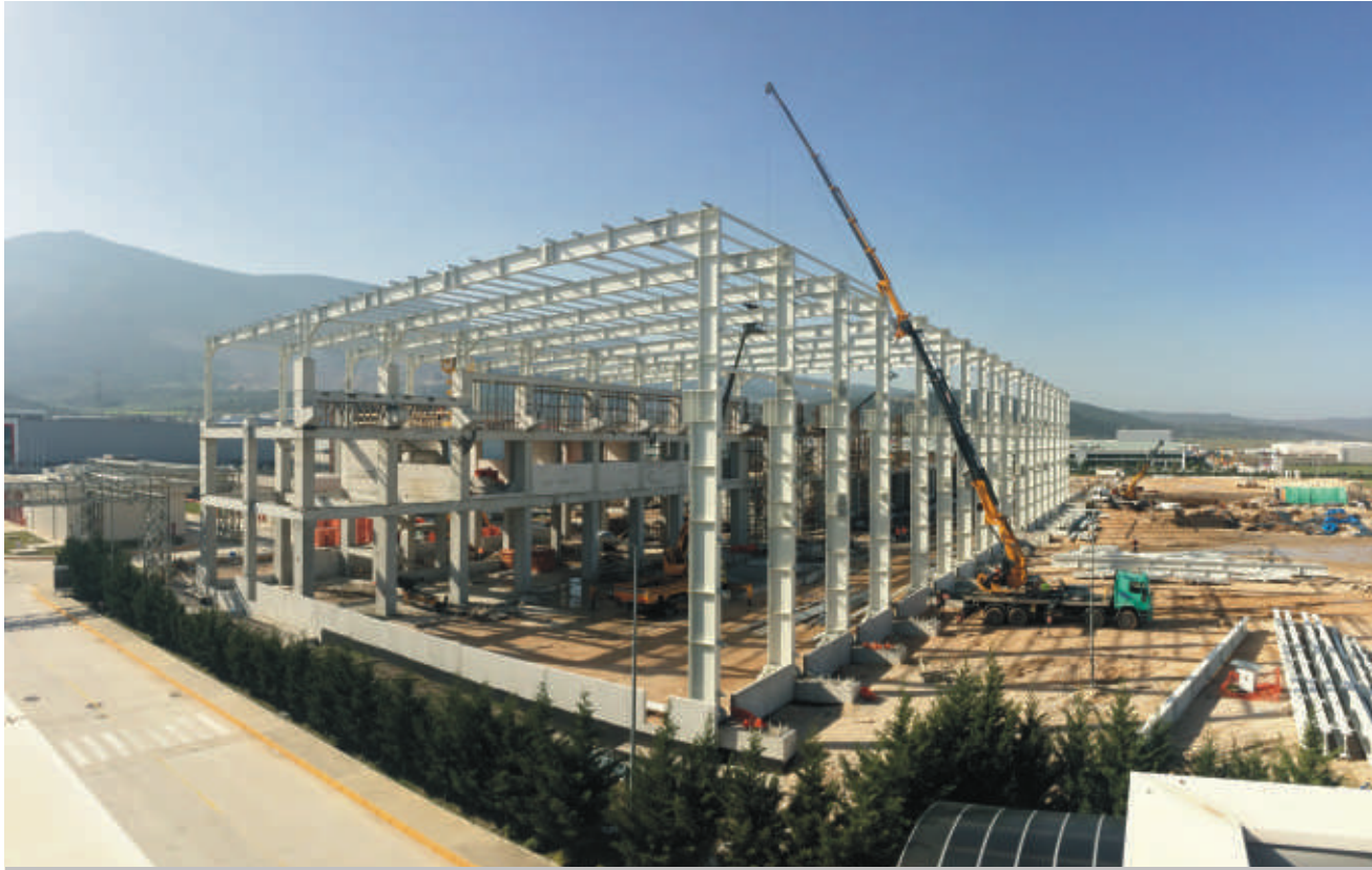
KM 4 binasının betonarme ve çelik taşıyıcı sistem imalat ve montajları İnşaat ve Çelik Gruplarımızca paralel olarak sürdürülmektedir.

Eczacıbaşı Topluluğu tarafından 1969 yılında çağdaş ve sağlıklı bir yaşamın gereği olan temizlik ürünlerini üretmek ve kullanımını yaygınlaştırmak üzere kurulan İpek Kağıt'ın önemli yatırımlarından biri olan Manisa Organize Sanayi Bölgesindeki 4. Kağıt Üretim Tesisi'nin inşaatı tüm hızıyla sürüyor.