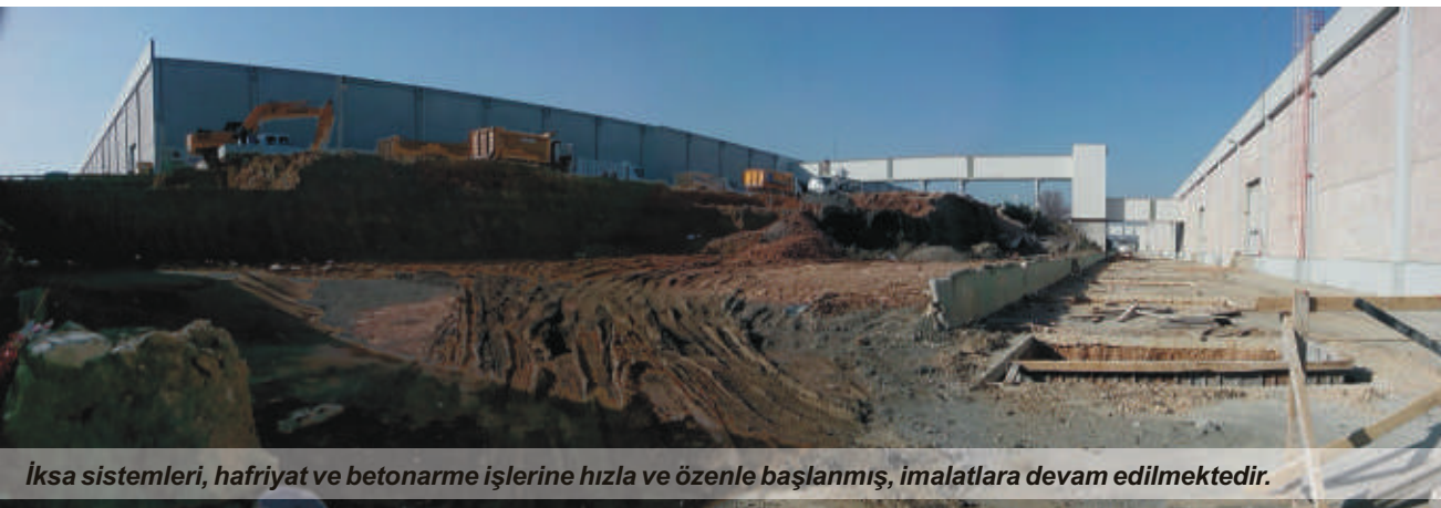
İksa sistemleri, hafriyat ve betonarme işlerine hızla ve özenle başlanmış, imalatlara devam edilmektedir.