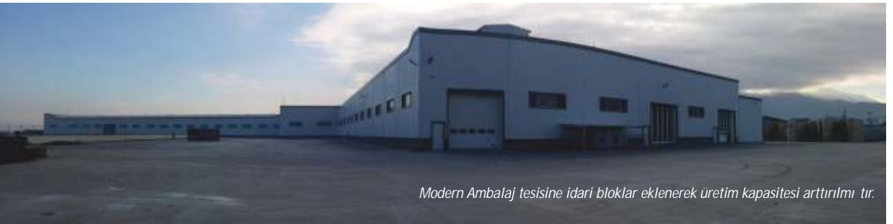
Modern Ambalaj tesisine idari bloklar eklenerek üretim kapasitesi arttırılmıştır.

Elektrik ve mekanik tesisat imalatları da dahil olmak üzere tüm imalatlar Sipil'in aat kalite ve güvencesiyle tamamlanmıştır. Çalışan bir tesiste imalat ve montaj süreçlerinde karşılaşılabilecek tüm zorluklara rağmen herhangi bir aksama meydana gelmeden ve iş kazası yaşanmadan tüm imalatları programına uygun tamamlamış olmanın verdiği gururu yaşamaktayız. Proje yapımı süresince görev alan antiyet yönetim ekibimize ve personellerimize teşekkür ederiz.