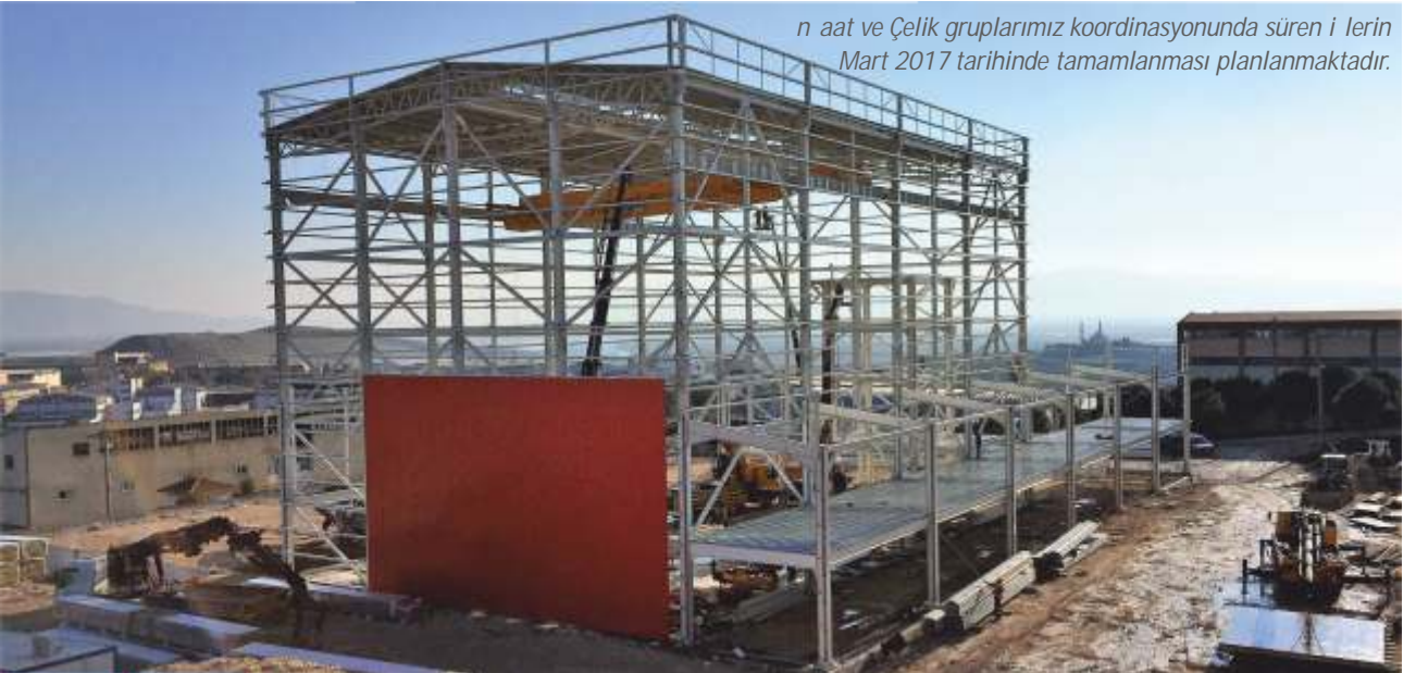
n aat ve Çelik gruplarımız koordinasyonunda süren i lerin Mart 2017 tarihinde tamamlanması planlanmaktadır.

Bütün bu imalat kalemleriyle birlikte Elektrik ve Mekanik uygulamalarda Sipil n aat tarafından yapılmaktadır. Toplam fabrika alanı geni letilecek ekilde mimari ve statik revizyonlar yapıldıktan sonra imalata devam edilecektir. Revizyonlarla birlikte Fabrika ve idari bina i lerinin Mayıs 2017'de tamamlanması planlanmaktadır.