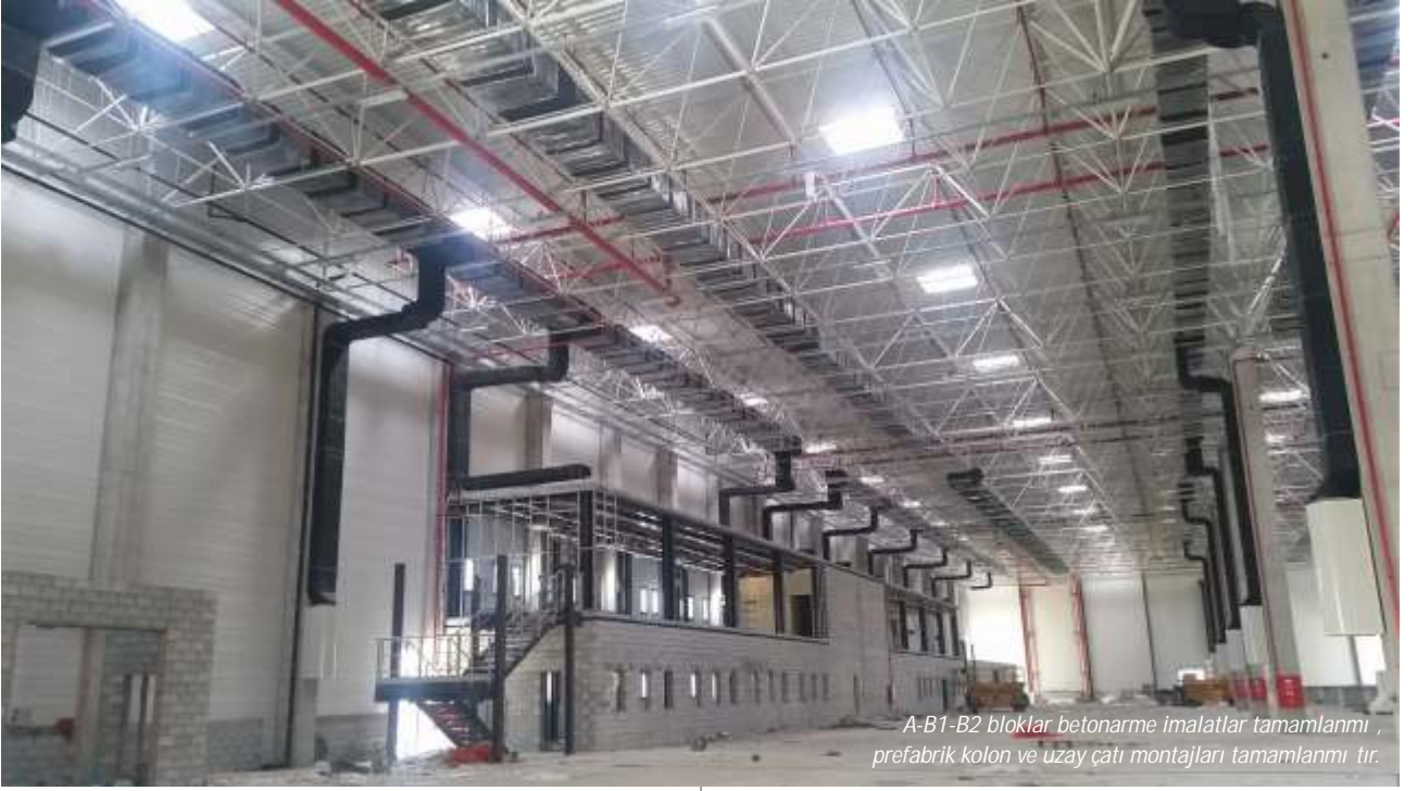
A-B1-B2 bloklar betonarme imalatlar tamamlanmı , prefabrik kolon ve uzay çatı montajları tamamlanmı tır.

Cephe imatları sonlandırılma a amasına gelmi tir. Bu blokta devam eden süreç proses imatlarıyla beraber ilave i olarak yürüyecektir.