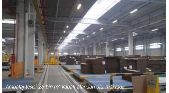
Ambalaj tesisi 26 bin m 2 kapalı alandan oluşmaktadır.

Oluklu ambalaj sektörünün Türkiye'de ki öncü kuruluşlarından olan Modern Ambalaj; Sipil'in aat yükleniciliğinde Temmuz 2015 tarihinde başlatılan Manisa fabrikasına yaptığı ilave üretim binası, mevcut fabrika içi renovasyon işleri ve yardımcı tesislerin aat yatırımı Kasım ayında tamamlanmıştır. Modern Ambalaj böylece kapasitesini arttırarak hacmini geliştirmiştir.