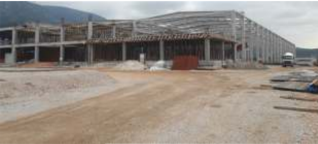
10 bin m 2 kapalı alandan olu an fabrika binasının ta ıyıcı sistem imalatları için hazırlıklar sürdürölmektedir.

sa lı ı ve güvenli ine önem veren çevre bilincine sahip ekipleri ile Türkiye'ye de er katmaya devam eden Sipil n aat bu projede de dinamik bir eilde ba arı odaklı çalı masını sürdürmektedir.