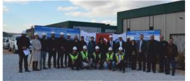
ECE irketler Grubu Manisa Fittings Parça Üretim Tesisi Temel Atma Töreni 16 Kasım 2016 tarihinde gerçekte ti.