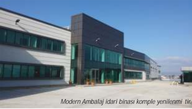
Modern Ambalaj idari binası komple yenilenmiştir.

Manisa Muradiye Organize Sanayi Bölgesi'nde yer alan Modern Ambalaj Üretim Tesisi 26 bin m 2 kapalı alandan oluşmaktadır.