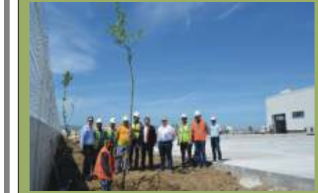
MODERN AMBALAJ MANİSA