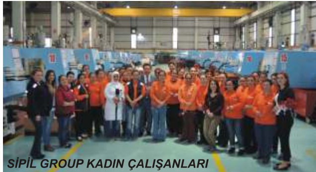
SİPİL GROUP KADIN ÇALIŞANLARI