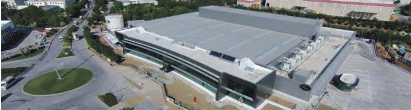
Gates Powertrain üretim startı 4 Mayıs 2016 tarihinde verildi.

GATES POWERTRAIN COMPANY projesi 2 bin 517 m 2 Ofis, 7 bin 116 m 2 Üretim, 692 m 2 Kanopi, bin 232 m 2 Yardımcı Tesisler, 39 m 2 Güvenlik Binası ve 90 m 2 Pompa Odası olmak üzere toplam 11 bin 686 m 2 kapalı alan ve 8 bin 500 m 2 açık alanla birlikte toplam 20 bin m 2 alana sahiptir.