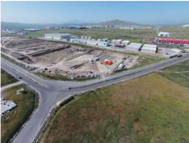
Proje kapsamında yaklaşık 110 bin m 3 olan hafriyat çalışmaları yüzde 80 oranında tamamlanmıştır.