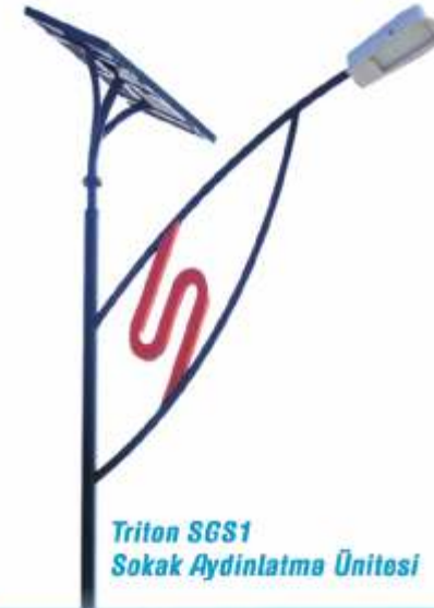
Triton SGS1 Sokak Aydınlatma Ünitesi