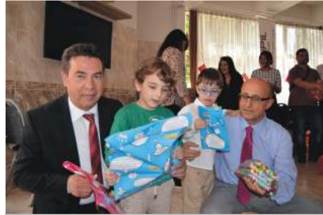
Sipil Group Yönetim Kurulu ve çalışanları Manisa ZİÇEV Eğitim ve Rehabilitasyon Merkezini 23 Nisan Ulusal Egemenlik ve Çocuk Bayramı kapsamında ziyaret etti ve hediyeler dağıttı.

Sipil Group Sosyal sorumluluk projeleri çerçevesinde özel günler ve haftaları bu örnekte olduğu gibi projelendirilerek gelecekte de kutlamaya devam edecektir.