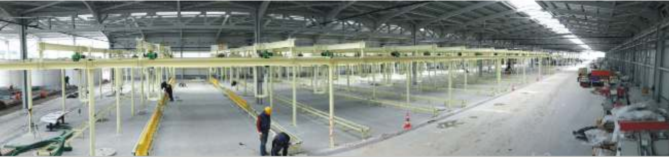
4. İşletme İnşaatı 2 etap şeklinde yapılacak olup kapalı alan olan 1. etap 21 bin 500 m2 alandan oluşacaktır.

Eczacıbaşı Yapı Gereçleri San.ve Tic. A.Ş. Vitra Grubu 4.İşletme İnşaatı çalışmaları iş programına uygun olarak hızla devam ediyor.