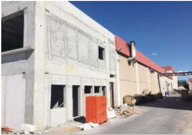
2016 yılının Şubat ayında imalatlara hızla başlanmış, alt yapı ve prefabrik işleri tamamlanmıştır.