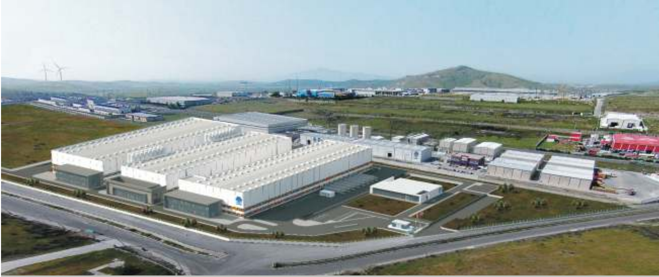
Ravago ALOSBI Üretim ve Depolama Tesislerinin temel atma töreninin 14 Haziran 2016 tarihinde gerçekleştirilmesi planlanmıştır.

Plastik sektöründe köklü bir geçmişe sahip Belçika merkezli Ravago Grup 200'den fazla şirketi ile üretim, satış, dağıtım ve geri dönüşüm konusunda; dünyanın 3 kıtasında 30 fabrikası ve 1 milyon ton üretim kapasitesiyle 50 ülkede faaliyet göstermektedir.