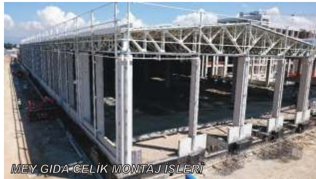
MEY GIDA ÇELİK MONTAJ İŞLERİ

kısmı sevk edilmiş ve imalatların yüzde 98'i tamamlanmıştır. Yangın dayanımlı boya konusunda Jotun firması ile referans alan çalışmaları ile uygulanmaya devam edilmektedir. Hava sıcaklığının eksi dereceli olduğu dönemlere rağmen, ortalama 2 bin 500 Mikronmetre alçı kıvamlı su bazlı 120 dakika yangın geciktirme dayanımlı boya uygulaması, boya kurutma fırını sayesinde hızlı bir şekilde uygulanabilmektedir. Çelik ve İnşaat gruplarının ortak koordinasyonu ile yürütülen proje kapsamında betonarme, prefabrik ve çelik taşıyıcı sistemlerin hepsi aynı yapı altında tasarlanmış ve imalat ve montajları inşaat ve çelik gruplarımızca gerçekleştirilmiştir.