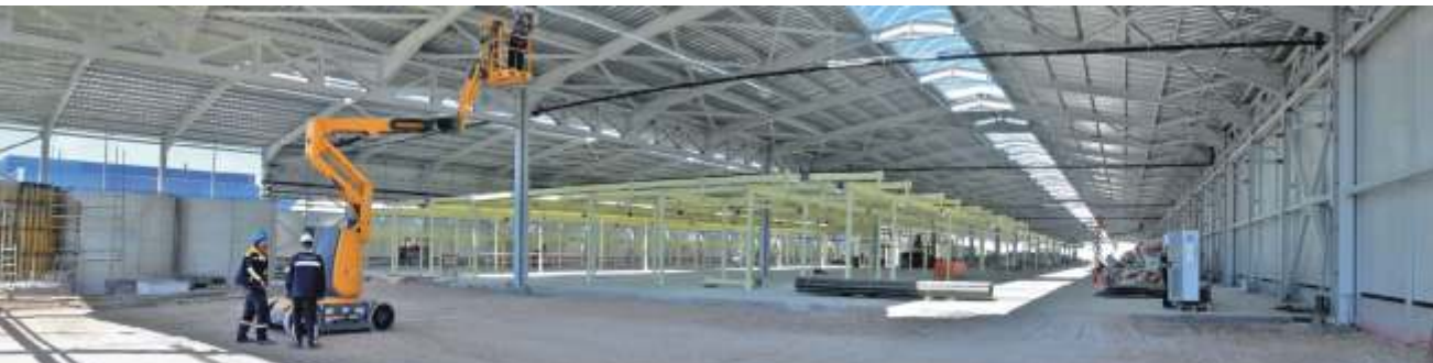
1.etap işlerinde imalat ve montaj işleri Sipil Çelik tarafından yürütülmektedir. Taşıyıcı sistem çelik konstrüksiyon olarak bin 150 ton çelik kullanılması planlanmıştır.