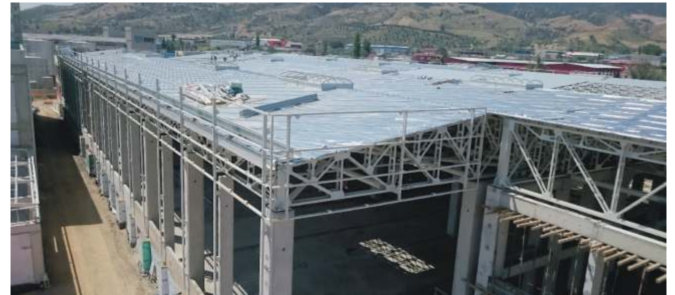
Mey Alaşehir Üretim Tesisi inşaatında çatı cephe montaj işleri hızla yürütülmektedir.

Mey Yönetim Ekibi, Proplan Yönetim Ekibi ve Sipil Group Yönetim Ekibi düzenli olarak koordinasyon toplantıları ile bu süreci hızlı, kaliteli, İSG mevzuatı ve şartnamelerine uygun olarak yürütme doğrultusunda çalışmalarını sürdürmektedir.