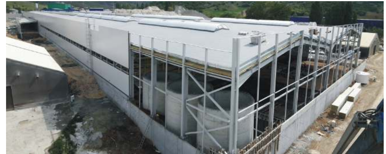
Sipil İnşaat ve Çelik grupları ile birlikte gerçekleştirilen inşaat çalışmalarının iş programına göre 21 Temmuz 2016 tarihinde tamamlanması planlanmıştır.

Vitra Grubu 4.İşletme inşaatı projesine yapmış olduğu katkılardan dolayı SİPİL GROUP ailesinin tüm çalışanlarına teşekkür ederiz.