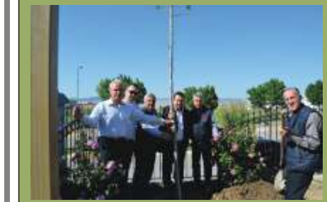
SKP MAKİNA MANİSA

Manisa'da geçtiğimiz dönem yapımları tamamlanan İpekkağıt, Sabaf, Modern Ambalaj ve SKP Makine Fabrika alanlarına, ayrıca İzmir Serbest Bölgede 4 Mayıs 2016 tarihinde açılışın yapıldığı gün hediye olarak Gates Fabrikasına çınar ağaçları dikilmiştir. Hakkı Bayraktar "Ağaç dikmek geçmişi geleceğe bağlar. Bir kuşağın diktiği ağacın gölgesinde gelecek kuşaklar serinler. Çevre Politikalarımız gereğince her şantiyemizin bitiminde ağaç dikmeye devam edeceğiz, çevreye duyarlılığımızı her alanda sürdüreceğiz" dedi.