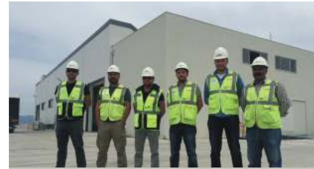
Modern Ambalaj yeni üretim binasının teslimiyle makina montajı başlamıştır.