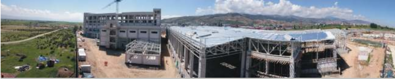
Mey Alaşehir Üretim Tesisleri'nde tüm çalışmalar iş programına uygun olarak hızla yürütülmektedir.

2004 yılında kurulan Mey, Türkiye'de biri üretim diğeri satış ve pazarlama olmak üzere iki ayrı şirket olarak faaliyetlerine devam etmektedir.