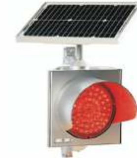
Solar İkaz Lambası