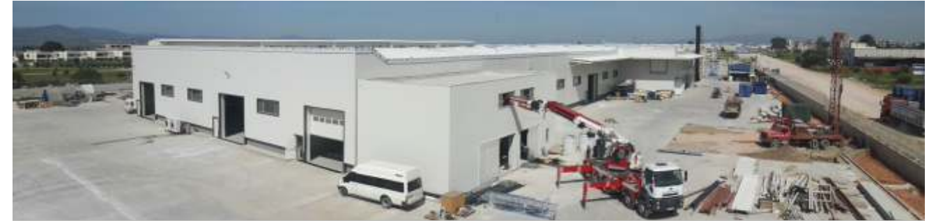
Modern Ambalaj yaklaşık 8 bin m 2 kapalı alana sahip olan A-B blok yeni üretim binası tamamlanmıştır.

Eren Holding bünyesinde faaliyet gösteren Modern Ambalaj Manisa fabrikası A-B blok yeni üretim binası ve yardımcı tesisleri Sipil İnşaat kalitesi ve güvencesi ile tamamlanmıştır.