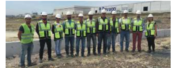
Ravago Şantiyesi Yönetim Ekibi