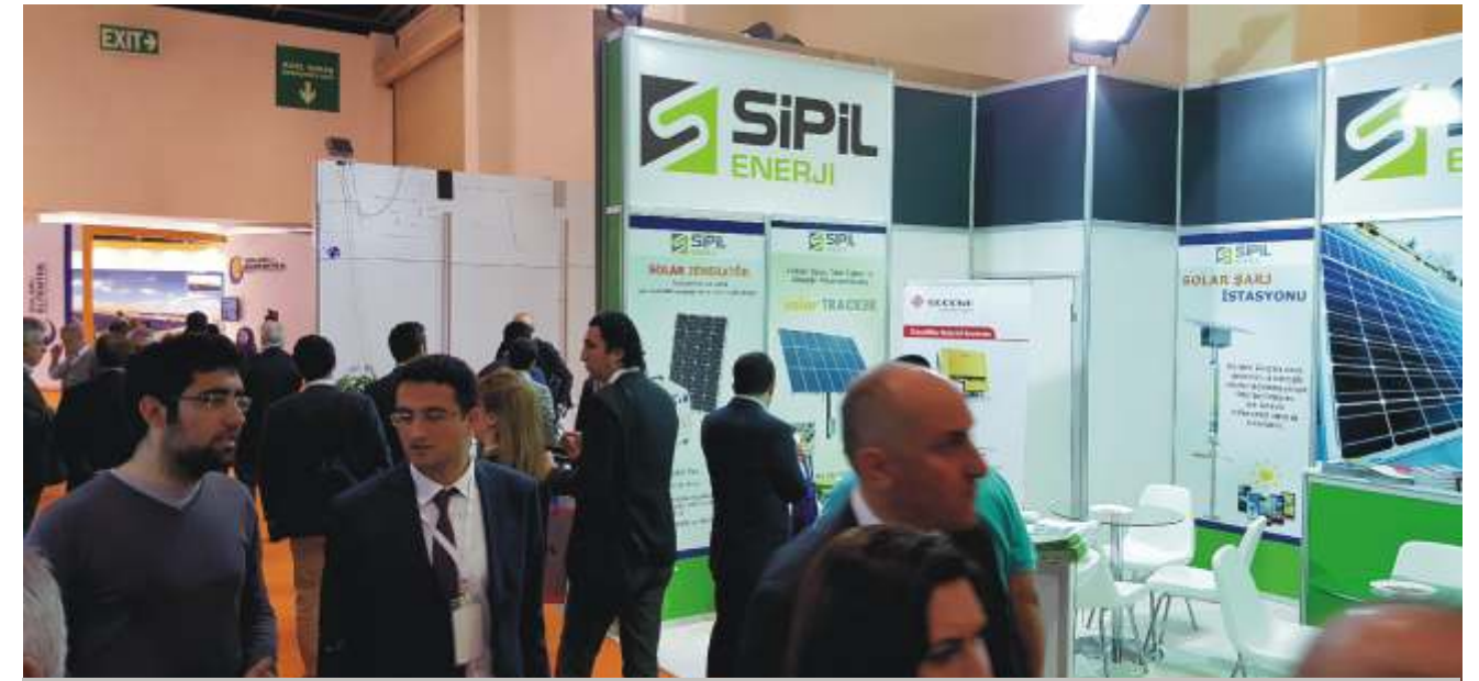
Sipil Enerji standı Solarex fuarında geleneksel yerini aldı.

Bu yıl 9.su düzenlenen Solarex İstanbul Uluslararası Güneş Enerjisi ve Teknoloji Fuarı'nda Sipil Enerji 4. kez yerini aldı. Artık gelenek haline