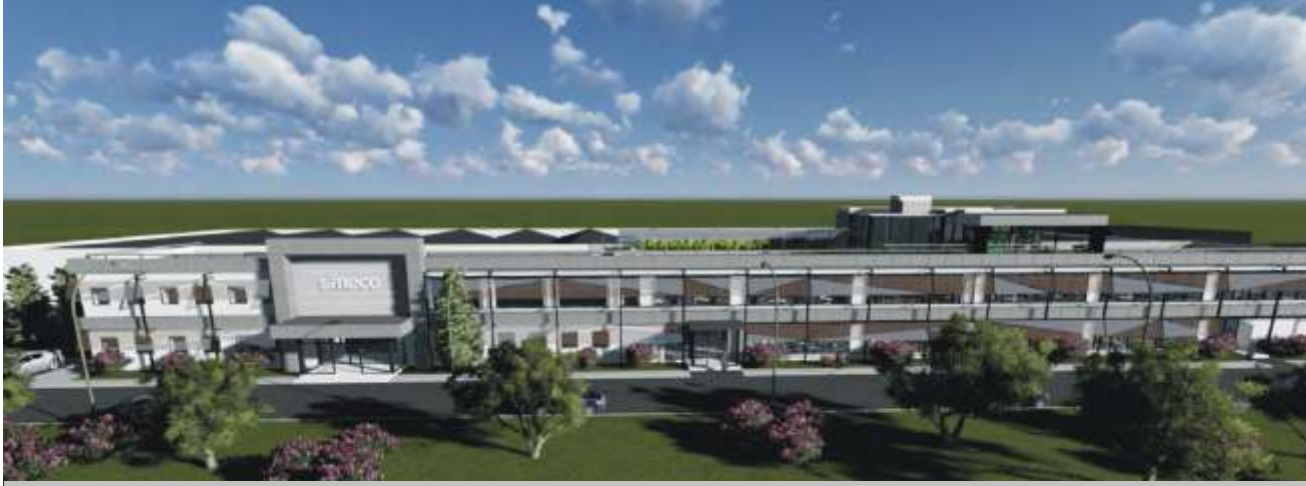
Simeco yatırımı Ege Serbest Bölgesi'nde yer almaktadır.

İzmir – Gaziemir Ege Serbest Bölgesinde ki 11 bin 500 m 2 'si kapalı, toplam 24 bin m 2 'lik tesisinde 200 çalışanı, 6 üretim bandı, tam donanımlı Ar-Ge laboratuvarları ile üretimine hızla devam eden Simeco firması Türkiye ve Dünyanın lokomotif ankastre ocak, fırın, davlumbaz üreticisidir.