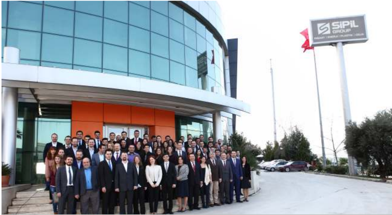
Sipil Yönetim Kurulu ve İdari Personeli 2016 yılı hedeflerini belirledi.

Yönetimi başlıklarında gerçekleştirilen sunumlar ardından birimlerin 2016 yılı hedefleri belirlendi. 13 birim özelinde belirlenen hedefler arasında öne çıkan başlıklar şunlardır : Şantiyeler Yönetimi 2016 yılında yapımı gerçekleştirilecek işlere ait ciro hedefini bir önceki yıla göre yüzde 50 arttırmayı hedeflemiştir. İş Geliştirme Teknik Ofislerimiz yurtdışı teklif sayısı oranımızı yüzde 2'ye çıkarmayı hedeflemiştir. Çelik İşletme Yönetimimiz ise yıllık 9 bin 500 ton kapasite hedefine karar vermiştir. Plastik İşletmelerimiz iş hacmini bir önceki yıla göre yüzde 8 arttırmayı karar altına almıştır. İnsan Kaynakları birimimiz ise yıllık toplamda 15 bin saat eğitim planlaması yapma kararı almıştır. İSG birimimiz 2015 yılına göre tüm işletmelerde ve şantiyelerde Kaza Sıklık Oranı (KSO) ve Kaza Ağırlık Oranlarını (KAO) yüzde 15 azaltma hedefi öngörmüştür. Katılımcı anlayışla ortak akli birlikte oluşturmayı amaçlayan verimli bir Yönetim Gözden Geçirme toplantısı sonrasında Yönetim Kurulu ve İdari personelimiz birlikte anı fotoğrafı çekmiştir.