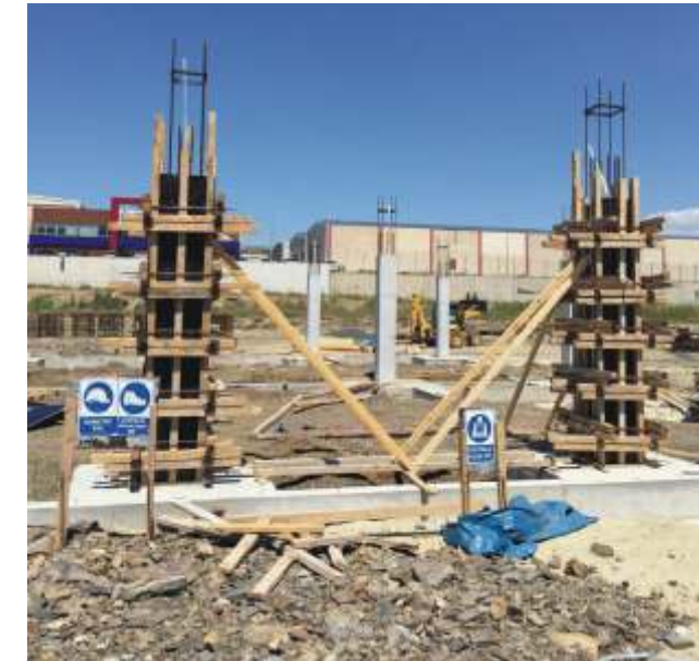
Kazı, dolgu ve betonarme imalatlar hızla devam etmektedir.

Ravago ekibi üretim ve depolama tesislerinin temel atma töreninin 14 Haziran 2016 tarihinde gerçekleştirilmesi planlanmıştır.