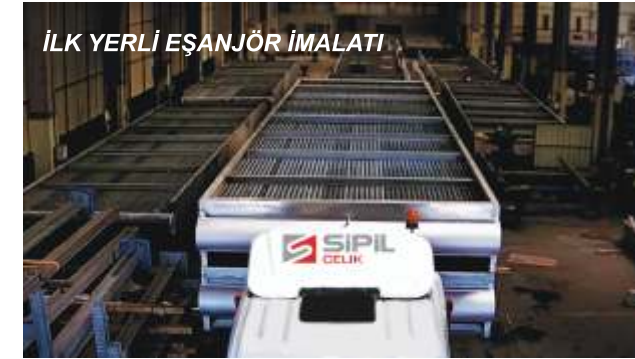
İLK YERLİ EŞANJÖR İMALATI

Sipil Çelik tarafından yurtdışına üretilen Spig Soğutma ısı kazanım tesisleri imalatları kapsamında 300 tonluk ve 150 tonluk imalatları tamamlandı. Ayrıca Aydın ilimizde yapılacak enerji santrallerinin, 550 tonluk imalatı tamamlanmıştır..