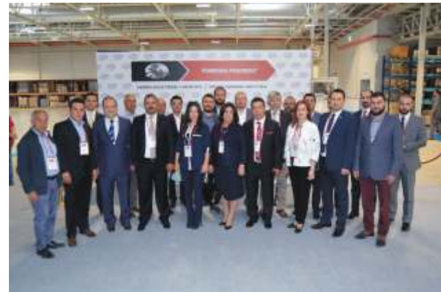
Sipil Group Yönetim Ekibi