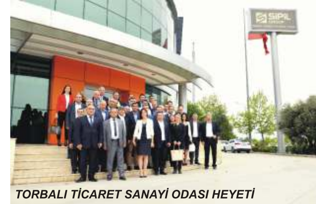
TORBALI TİCARET SANAYİ ODASI HEYETİ