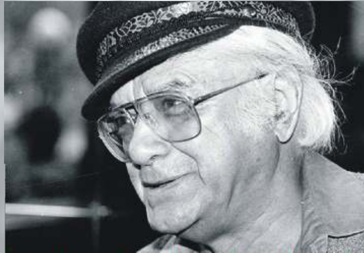
Atilla İlhan 1925-2005

Bitmez sazların özlemi daha sonra daha sonra Sonranın bilinmezliği bir boyut katar ki onlara Simsiyah bir teselli olur belki kalanlara Geceler uzar hazırlık sonbahara