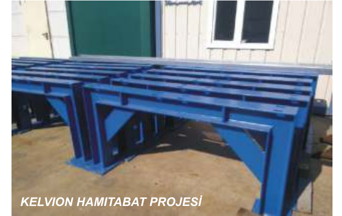
KELVION HAMİTABAT PROJESİ

Tamamı galvaniz kaplamalı olan imalatlar planlandığı gibi 30 Mayıs 2016 tarihinde tamamlanacaktır.