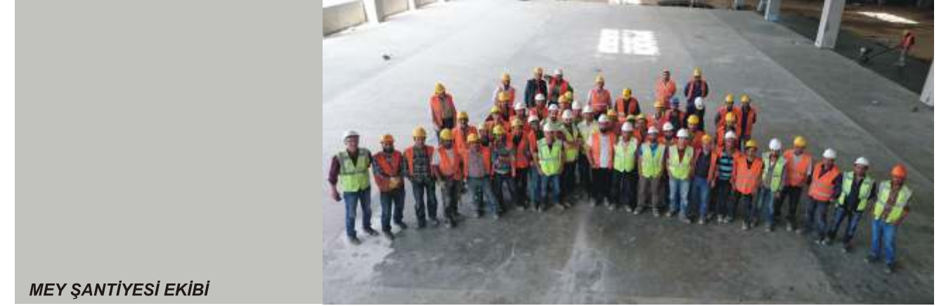
MEY ŞANTIYESİ EKİBİ